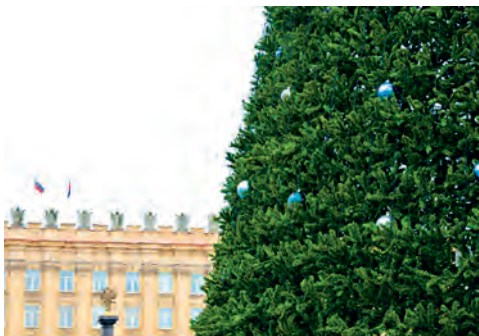
На Соборной площади украшают ёлку