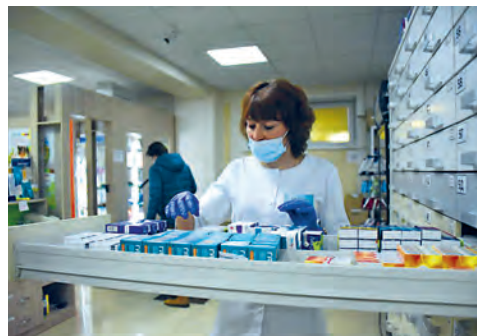
Дефицита лекарств нет