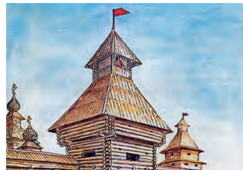
История белгородской крепости