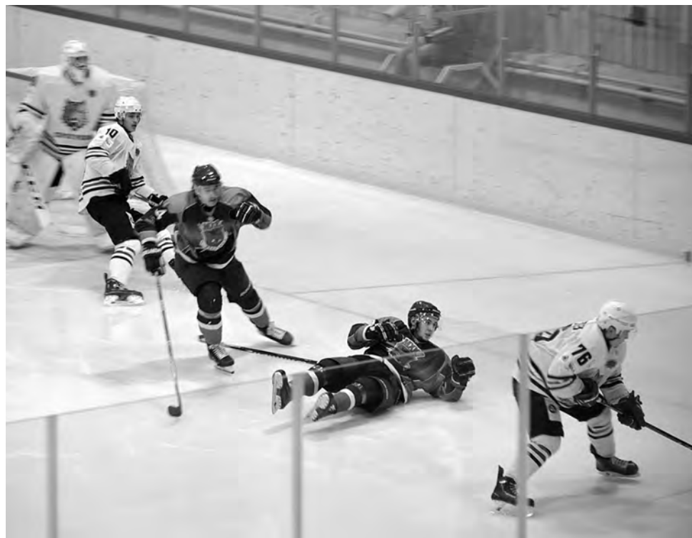
ФОТО МХК «БЕЛГОРОД» ВКОНТАКТЕ

► Хоккеисты провели два матча в первенстве НМХЛ.