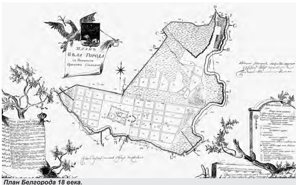
План Белгорода 18 века.