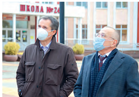
Рабочая поездка по городу