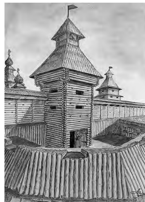
Башни третьей Белгородской крепости. Реконструкция А.А. Ильина.

О занятиях местного населения в «Экономических примечаниях» сообщалось, что купцы и мещане «торг имеют не в одном том городе, отъезжают в другие города» с различными товарами. Женщины «упражнялись» в домашнем рукоделии: пряли лён, вязали чулки, плели кружева для собственных нужд и на продажу.