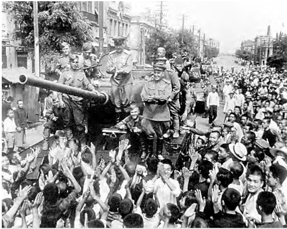
Население города Далянь встречает освободителей.

Утром 9 августа 1945 года советские войска пересекли государственную границу с территории Приморья и Забайкалья и развернули боевые действия в Манчжурии. Вскоре о начале военной кампании узнали жители Белгорода. 10 августа газета «Белгородская правда» опубликовала заявление Советского правительства правительству Японии, в котором, в частности, говорилось: «Тре-