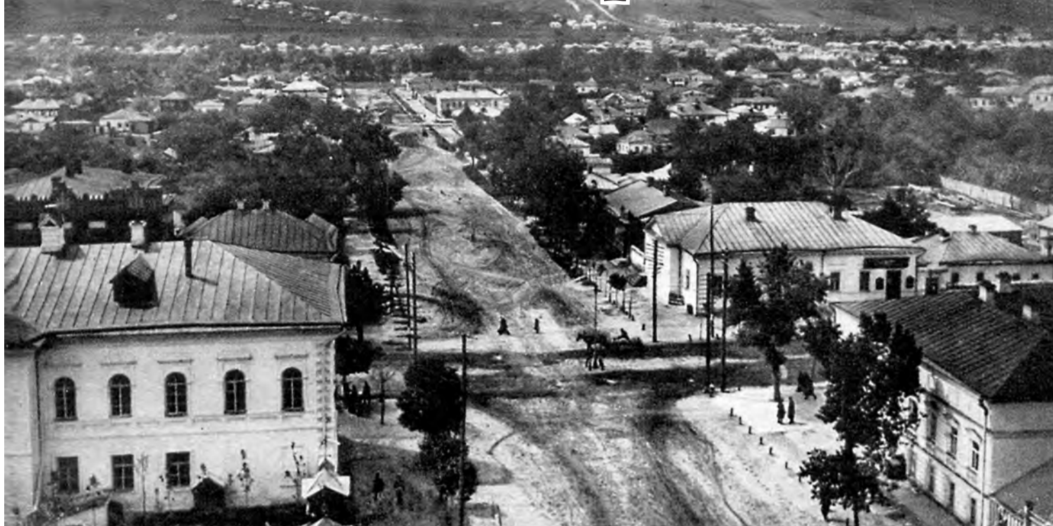
Здание Белгородской земской больницы на углу улиц Корочанской и Магистральской (справа).

2,2 коп., свинины за один килограмм - 10-22 коп., десятка яиц - 20 коп.).