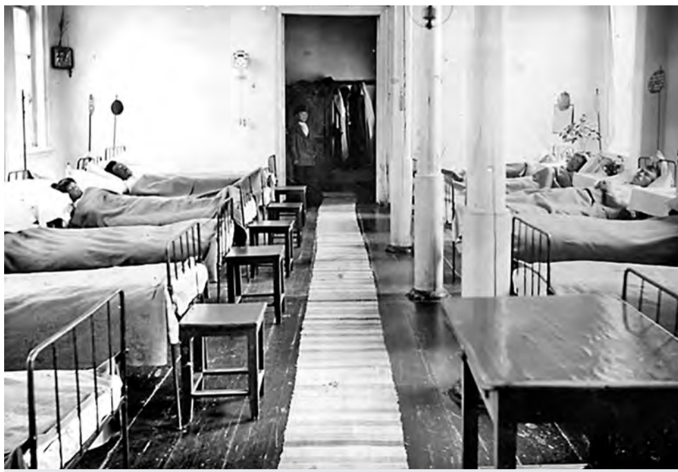
Палата земской больницы.

Ещё через год земское собрание решило пригласить на службу повивальную бабку, которая приступила к работе в начале 1869 года. Годовое жалование ей определили в размере 300 рублей. Понятие «повивальная бабка» сегодня сложно и непонятно. Современник сразу представит безграмотную пожилую знахарку, с сомнительной внешностью и странным поведением. Однако повивальные бабки в XIX веке имели высшее медицинское образование и готовились повивальными институтами, которых в стране насчитывалось не менее двух десятков. Диплом на звание «повивальная бабка» выдавался по окончании шестилетнего обучения и принятия «Присяги повивальных бабок о должности их». Работа их состояла в постоянных разъездах по селам и деревням уезда для оказания помощи роженицам и новорожденным младенцам, а также консультаций и наставлений сельских повитух. Уже к концу XIX века это определение постепенно исчезнет и появится современное «акушерка».