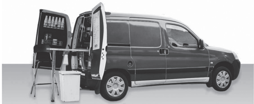
Типовое решение внешнего вида нестационарного торгового объекта без специализации по группе товаров, размещаемого на территории городского округа «Город Белгород»