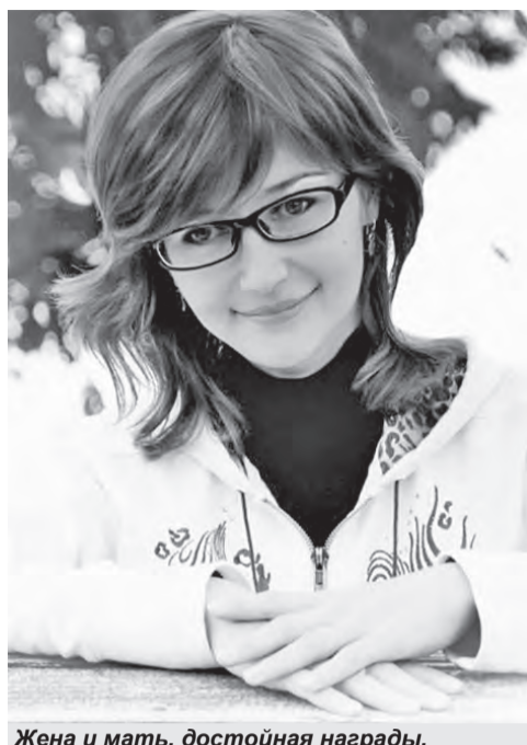
Жена и мать, достойная награды.

- Я не хотела отказываться от своих корней. Я ими горжусь, потому что я немка по национальности. У меня папа - немец. И по традиции, так как я живу все-таки в России, надо брать фамилию мужа. Я предложила ему: «Как ты смотришь на то, что я буду с двойной фамилией?». Он посмотрел на меня и сказал: «А почему только ты? И я хочу», - вспоминает лучшая мама.