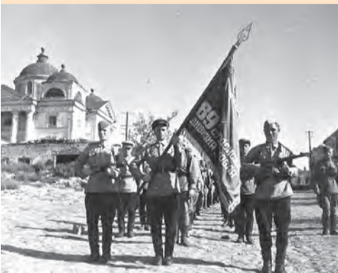
89-я гвардейская дивизия вступает в Белгород. 1943 г.

В этих коротких и правдивых строках раскрывается обаятельный образ наших земляков-воинов, не жалеющих своей крови и самой жизни для достижения победы над проклятым врагом. Победа близка, но успокаиваться нельзя ни на минуту. Каждая такая передышка может оттянуть час всенародного торжества.