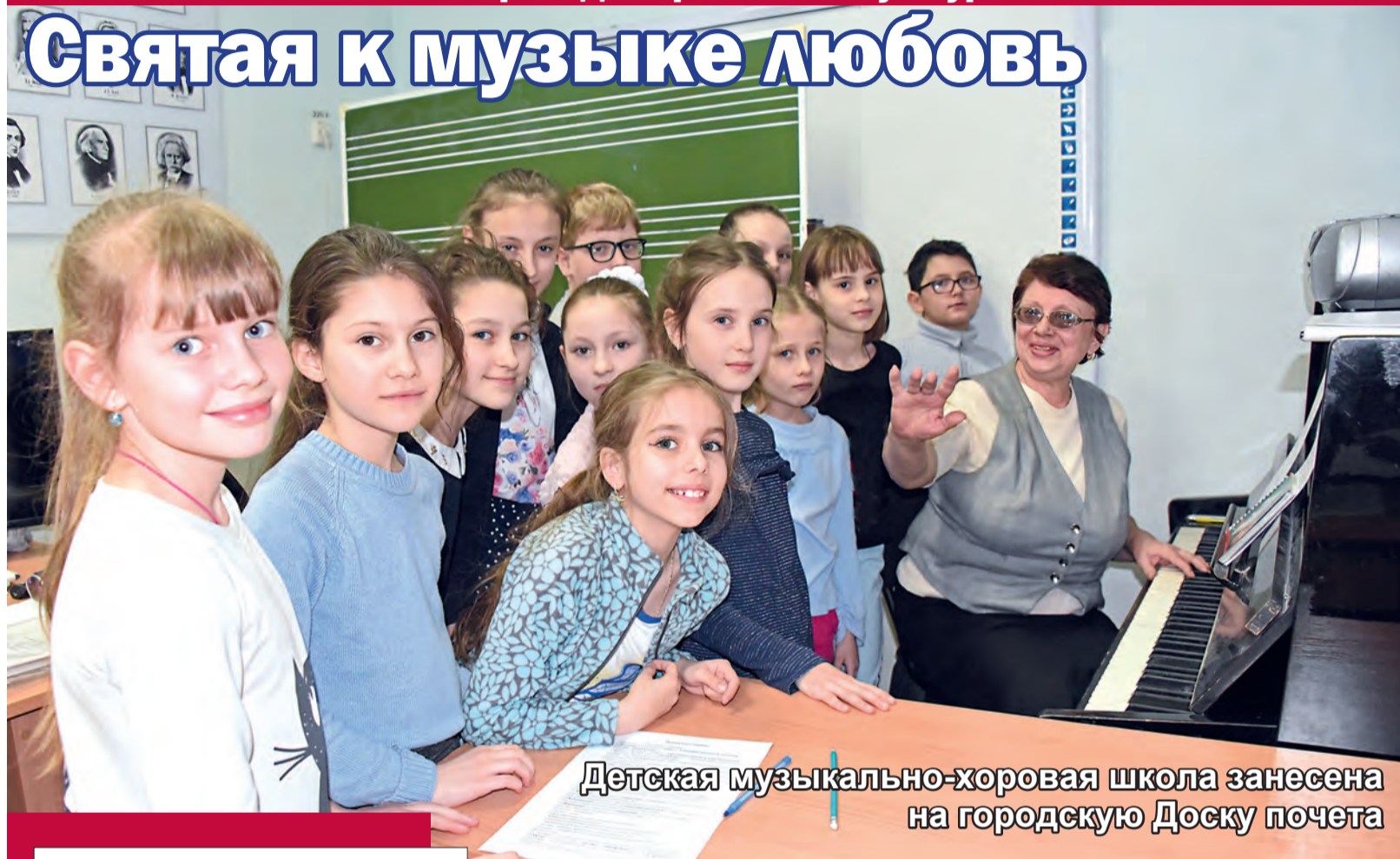
Детская музыкально-хоровая школа занесена на городскую Доску почета