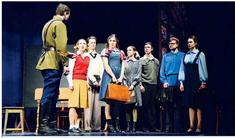
Сцена из спектакля «Завтра была война».