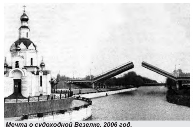
Мечта о судоходной Везелке, 2006 год.

- Самым главным событием текущего года в вузе стало открытие астролидарной обсерватории. Как заявил ректор БелГУ, по статусу классический университет обязан иметь обсерваторию. В цоколе обсерватории расположен автоматизированный коммуникационный мультимедийный комплекс с девятью плазменными панелями и мощной акустической системой, полностью окружающей присутствующих звуком. Астрофизическая многофункциональная обсерватория БелГУ была создана при поддержке областной администрации в рамках реализации федеральных целевых программ: «Снижение рисков и смягчение последствий чрезвычайных