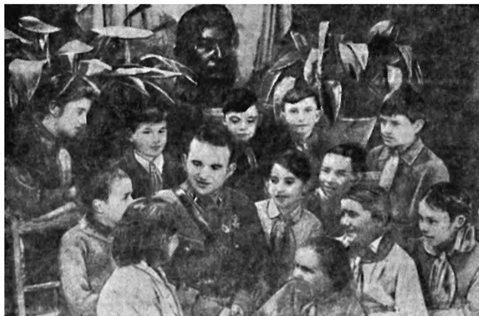
Наш земляк, Герой Советского Союза капитан В. Р. Филатов среди детей.

В конце 1939 г. В.Р. Филатову был предоставлен отпуск. В первых числах января 1940 г. в Белгороде (в то время райцентре Курской области) стало известно, что на малую родину приезжает участник Халхин-Гольских боев, удостоенный звания Героя Советского Союза. Поздно вечером 14 января на железнодорожном вокзале Белгорода знатного земляка ожидали родные, друзья, представители партийных и государственных органов. Каждые пять минут станционный диспетчер сообщал о движении пассажирского состава: «Поезд прошел Сажное. Поезд подходит к Беломестному». 15 января 1940 г. в 0 часов 10 минут В.Р. Филатов прибыл в Белгород.