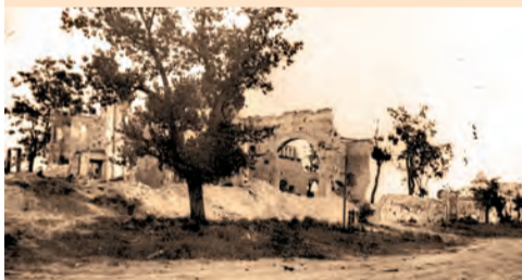
Перекресток Свято-Троицкого бульвара и пр. Б. Хмельницкого.

Это намного бы сократило расход дефицитных материалов - железа, асбофанеры, шифера и черепицы.