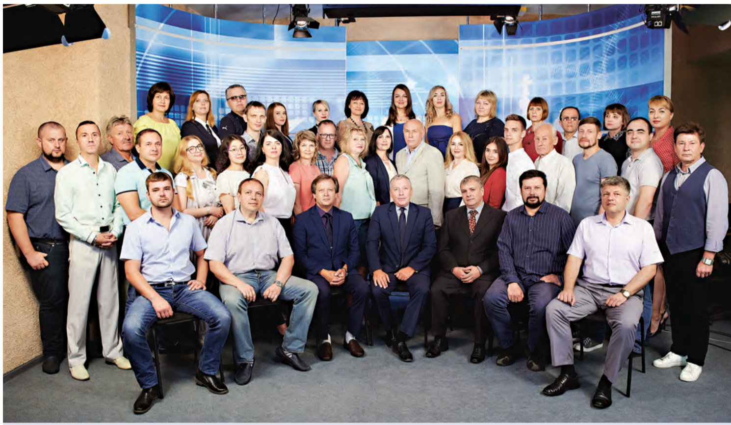
Коллектив МАУ «Белгород-медиа» занесен на городскую Доску Почета.