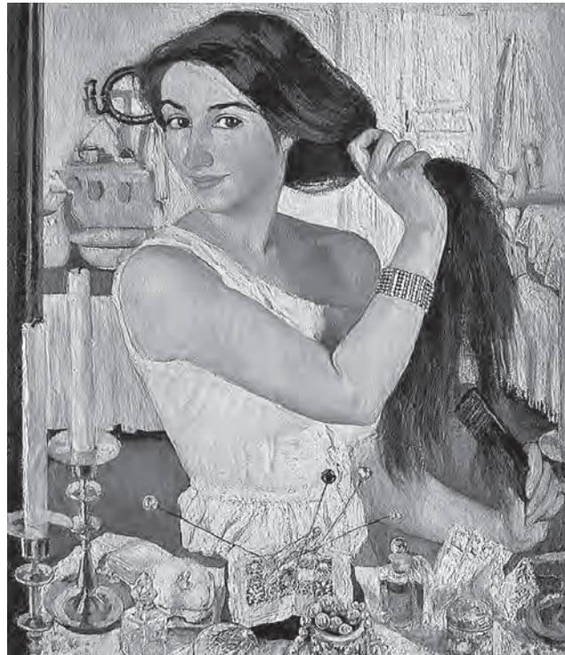
ФОТО ИЗ СВОБОДНЫХ ИСТОЧНИКОВ

Вскоре после свадьбы Зина уехала в Париж - каждый уважающий себя художник просто обязан был побывать