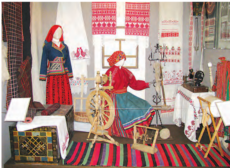
ФОТО МУЗЕЯ НАРОДНОЙ КУЛЬТУРЫ

В ней органично соединились научная достоверность содержания и яркая зрелищность показа. У белгородцев и гостей города появится уникальная возможность заглянуть в прошлое, увидеть настоящее и задуматься о будущем народной культуры.