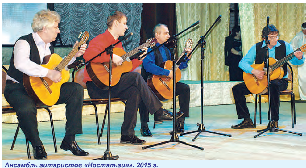
Ансамбль гитаристов «Ностальгия». 2015 г.

Ирина ШВЕДОВА