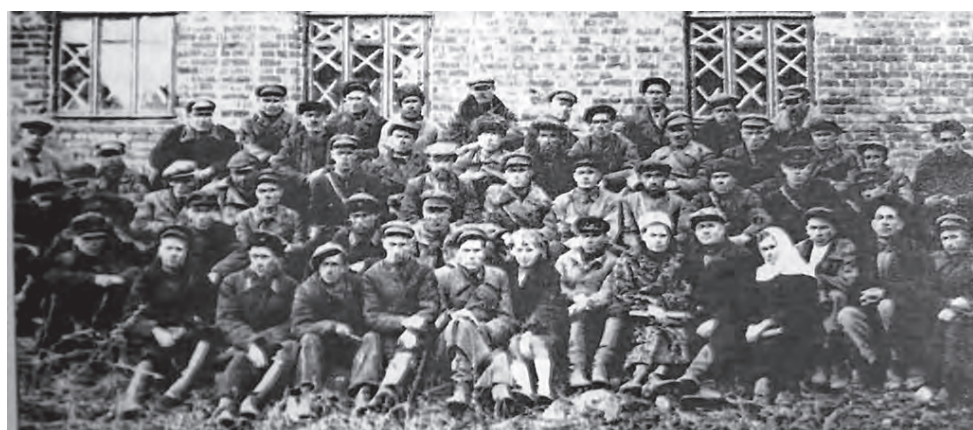
Белгородский партизанский отряд.

Немцы, дойдя до сел Мясоедово, Северково, Ястребово, Беловское, Разумное,