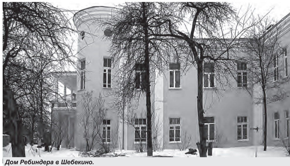
Дом Ребиндера в Шебекино.