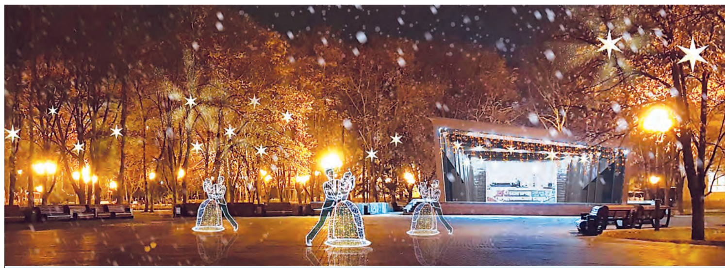
Танцплощадка в парке Победы.