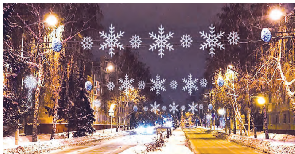
Улица Н. Чумичова.