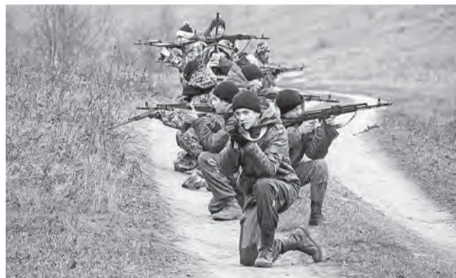
ФОТО УПРАВЛЕНИЯ РОСГВАРДИИ ПО БЕЛГОРОДСКОЙ ОБЛАСТИ

В рамках мероприятия бойцы спецназа Росгвардии продемонстрировали курсантам работу служебной собакой по обнаружению взрывчатых веществ.