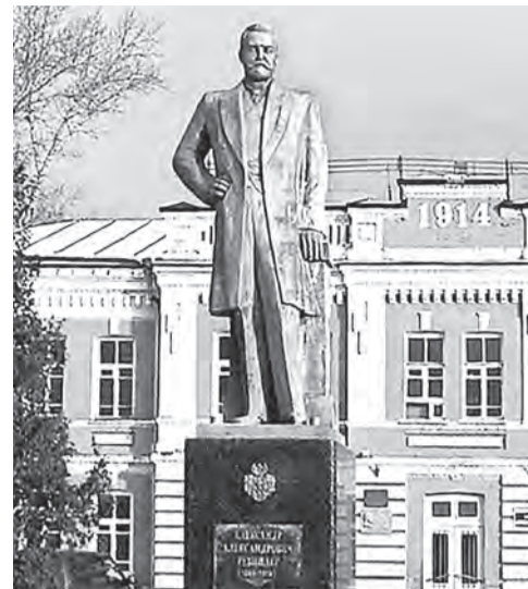
Памятник А. Ребиндеру в Шебекино.

Ребиндеры выделили часть средств на строительство в Шебекино нового Тихвинского храма, на организацию Белгородской