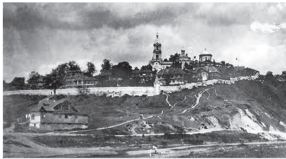
Богородице-Тихвинский монастырь до разрушения.

числом своих жителей даже губернские города...» - этими словами начинаются заметки Бронзова. Профессор посредством собственных впечатлений восстанавливает перед читателем живую картину обители и переносит его на более чем сто лет назад. Бронзов с горечью рассказывает, как сожгли домик Петра Великого и красивейшее здание, некогда принадлежавшее управляющему шереметьевскому имению, говорит и о прочих поджогах. Но есть строки и о светлых моментах. Профессор с теплотой описывает борисовцев, воодушевленно