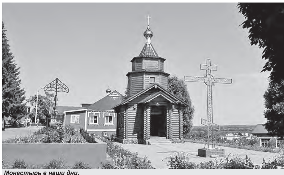
Монастырь в наши дни.