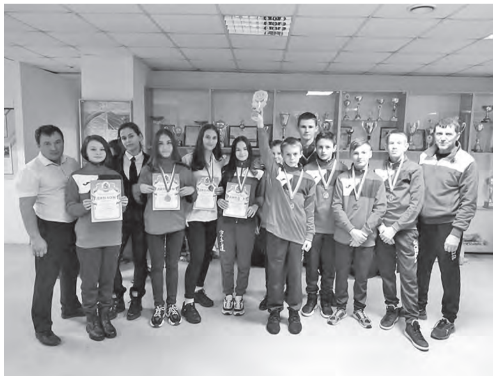
ФОТО СК «САКУРА»