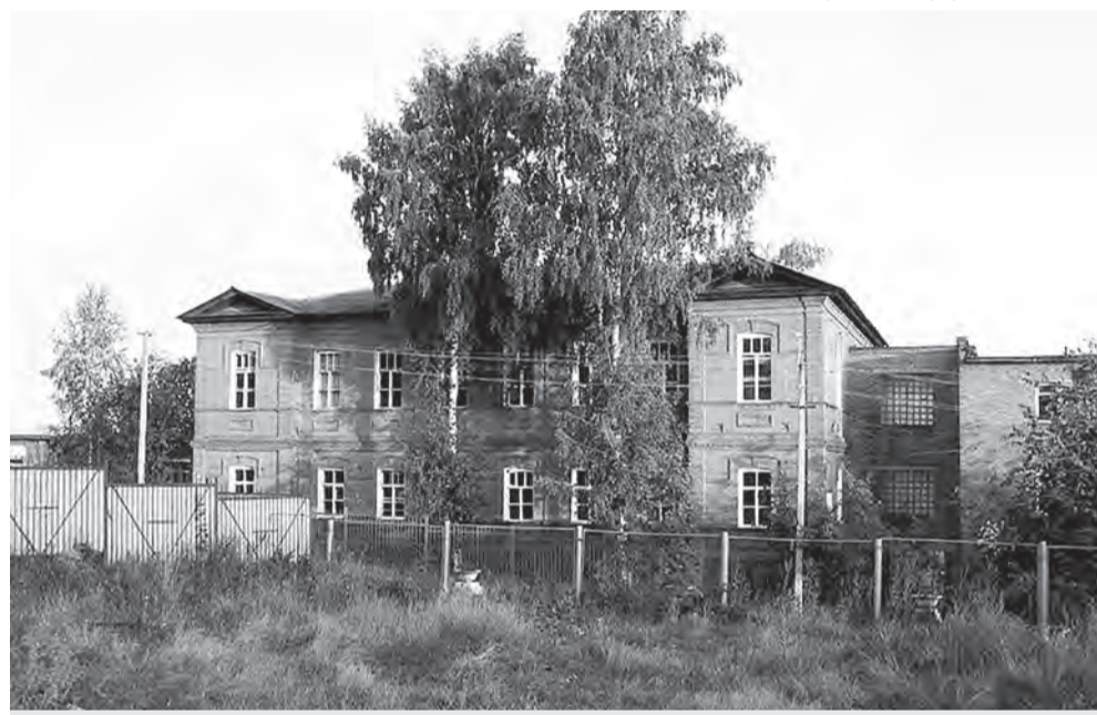
Сохранившийся корпус пустыни, бывшая школа-интернат.