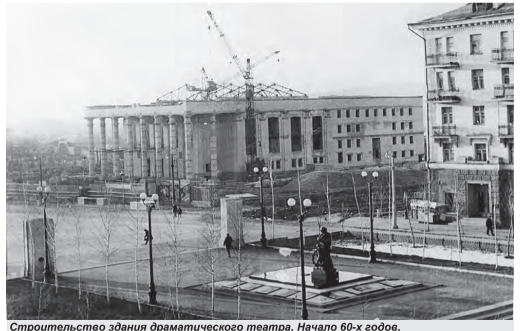
Строительство здания драматического театра. Начало 60-х годов.

Но оставался открытым вопрос о строительстве нового здания театра. Работа в этом направлении активизировалась в середине 1959 г. 24 августа 1959 г. исполнительный комитет Белгородского областного Совета депутатов трудящихся выделил дополнительно 500 000 рублей для нужд строительства. Между тем коллектив театра продолжал трудиться. Во время летних гастролей по районам области труппа дала 237 спектаклей, которые посетило более 120 000 сельских зрителей. 25 августа 1959 г. за добросовестный труд