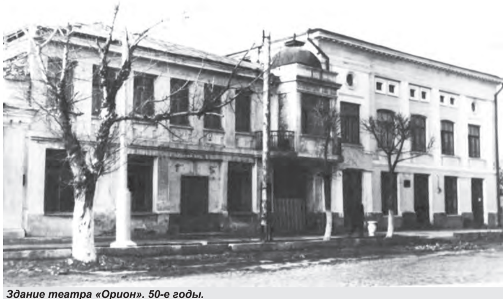
Здание театра «Орион». 50-е годы.

Весьма примечательно, что в здании по улице Ленина, 61, определенном для размещения театра, он уже находился ранее - до революции 1917 года театр носил название «Орион», а затем был переименован в городской театр. В 1950 г. театр был закрыт, а помещение отдано под городской Дом культуры. В настоящее время в этом здании по Гражданскому проспекту, 61, находится музей народной культуры. Однако в процессе капитального ремонта бывшего «Ориона» выяснилось, что и первый (кирпичный) этаж, и второй (деревянный, обложенный кирпичом) пришли в ветхое состояние и непригодны к дальнейшей эксплуатации.