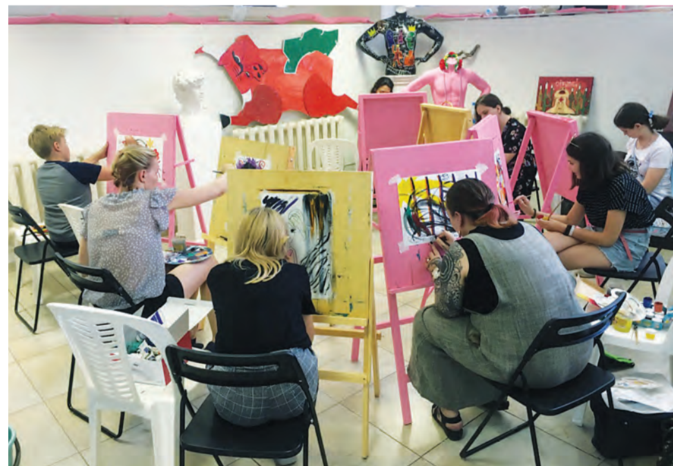
ФОТО ЕВГЕНИИ КАРАКАЙ

Евгения Каракай, младший научный сотрудник, художник, куратор направления «Кради как художник»: