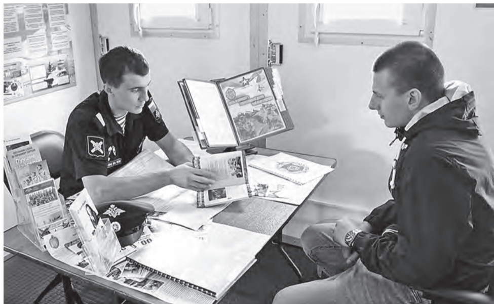
ФОТО ПУНКТА ОТБОРА НА ВОЕННУЮ СЛУЖБУ ПО КОНТРАКТУ

► В Белгороде провели акцию «Военная служба по контракту - твой выбор!», которая вызвала большой интерес горожан.