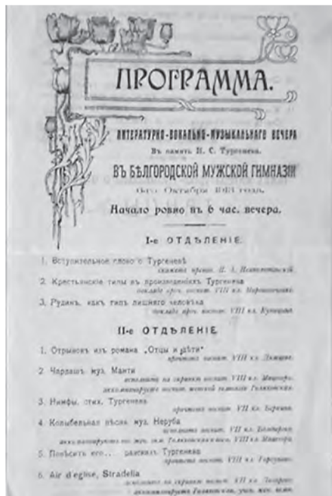
Программа литературно-музыкального вечера в память И.С. Тургенева в Белгородской мужской гимназии. г. Белгород. 1913 г.