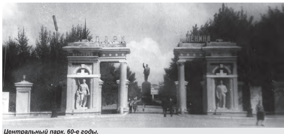
Центральный парк. 60-е годы.

Нынешнее любимое место отдыха белгородцев существовало ещё до революции, в конце XIX века. Здесь за чертой города был создан городской питомник, в котором крестьяне могли бесплатно получить посадочный материал и орудия для посадки. Площадь этой территории составляла 25 гектаров. Основную ее часть занимали ивы, на остальной территории выращивалось 300 тысяч лиственных и столько же хвойных деревьев. Вскоре парк стал стихийным местом отдыха горожан. В двадцатые и тридцатые годы периодически в местной печати поднимался вопрос о перестройке этого массива в настоящий парк. Но грянула Великая Отечественная война, и вместо планируемой зоны отдыха он стал кладбищем для немецких офицеров и солдат. После войны кладбище сровняли с землей, чтобы оно не напоминало о страшных временах фашистской оккупации. Центральный парк имени В.И. Ленина был официально открыт в 1956 году. Здесь были высажены тысячи деревьев. Центр парка украсил великолепный фонтан «Хоровод», рядом была создана детская площадка. В самом начале центральной аллеи установили памятник В.И. Ленину.