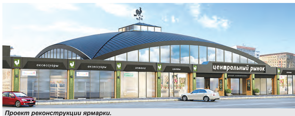
Проект реконструкции ярмарки.