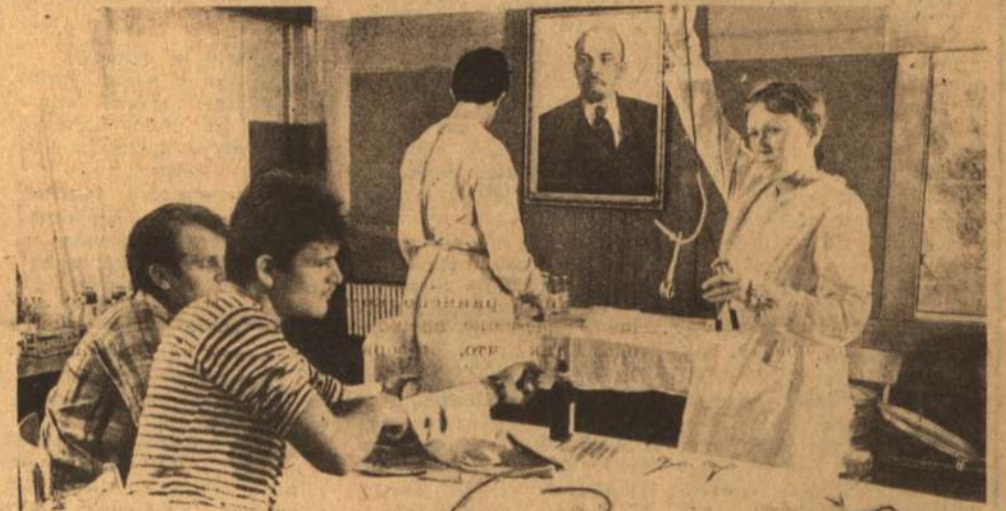
В красном уголке общепита Белгородского СХИ студенты сдают кровь. Условия идеологически стерильные: стакан

Вот почему мы против притязаний ПО «Сокол» на наши дома и приусадебные участки.