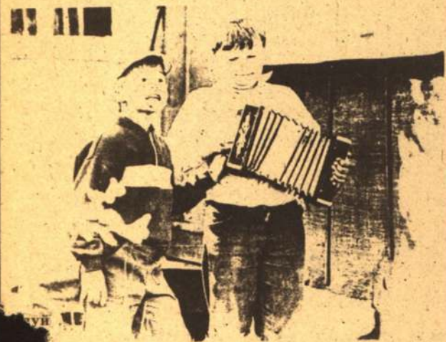
«Сегодня ночью я твоя, бэйби»

Мы попробуем исправить это положение. Ниже приводится список популярности исполнителей современной музыки, составленный в декабре одним из ведущих музыкальных журналов США «Биллборд».