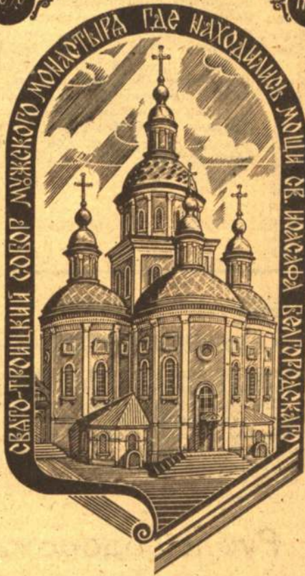
Гравюра из серии «Древний Белгород». С. КОСЕНКОВ.