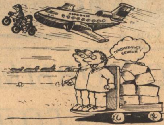
Рис. С. Расковалова.