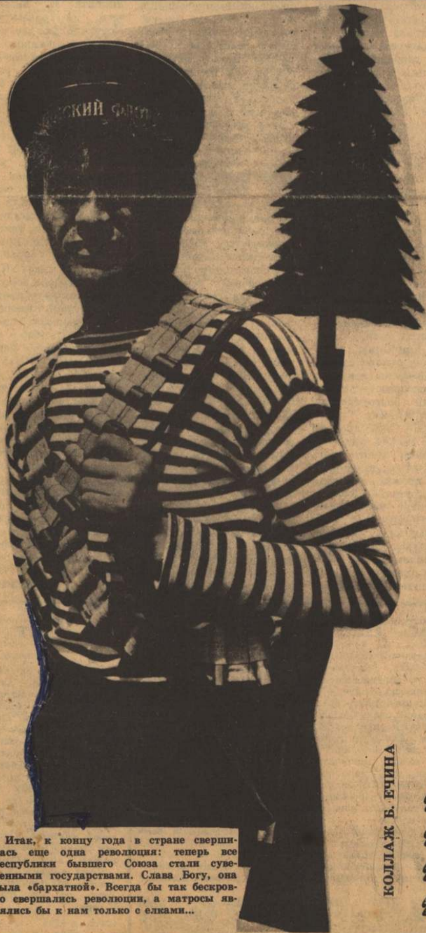
КОЛЛАЖ В. ЕЧИНА