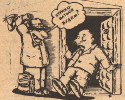
Рисует С. Расковалов