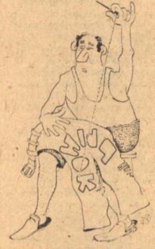
Рис. А. ПАНАСЕНКО