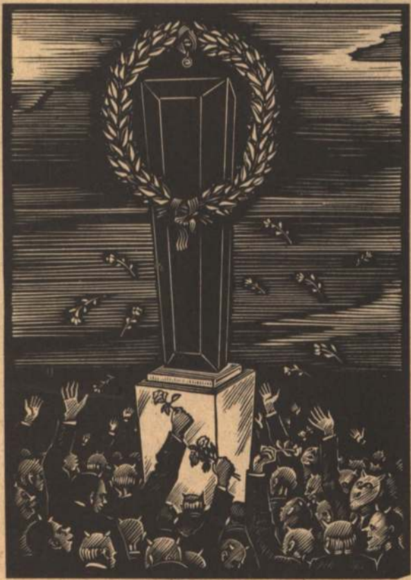
Настало время славить мозг, умерший мозг, гниющий мозг...