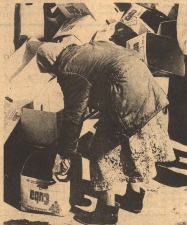
На первое — Декларация, на второе...