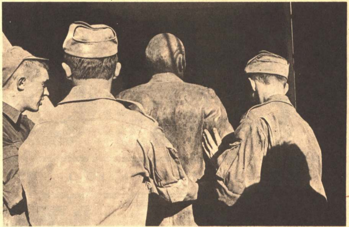
УЧАСТЬ ВОЖДЕН Первая жертва переворота (скульптуру В. И. Ле-

нина торжественно выдворяют из Преображенского собора — бывшего музея).