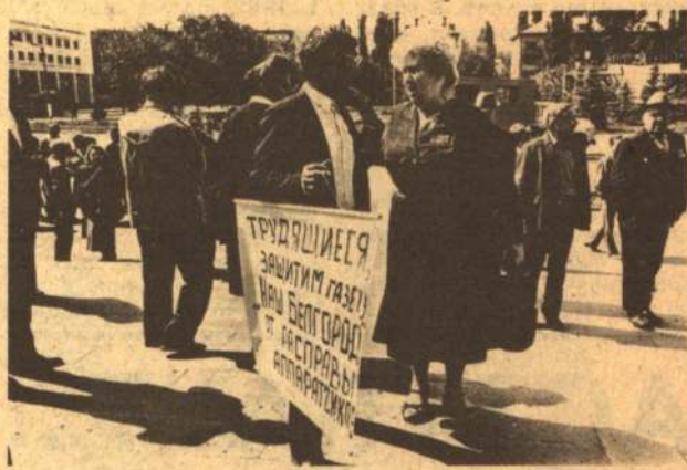
ДЕБАТЫ НАЧАЛИСЬ ЗАДОЛГО ДО НАЧАЛА СЕССИИ...