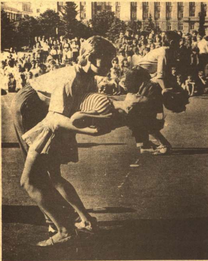
...УЧАТ В ШКОЛЕ, УЧАТ В ШКОЛЕ, УЧАТ В ШКОЛЕ...