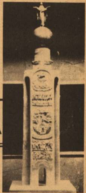
Проект памятника погибшим в Великой Отечественной войне. Автор — Вячеслав Клыкков.

Из этого документа видно, что областной Совет