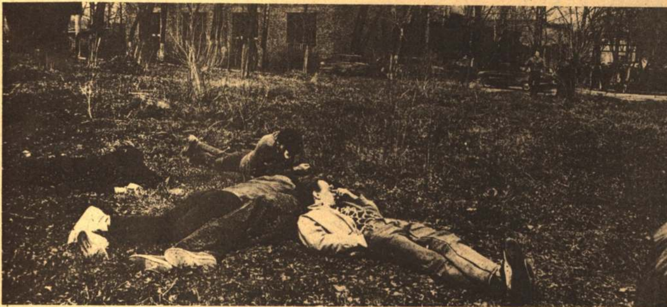
Забастовка, четвертый день.