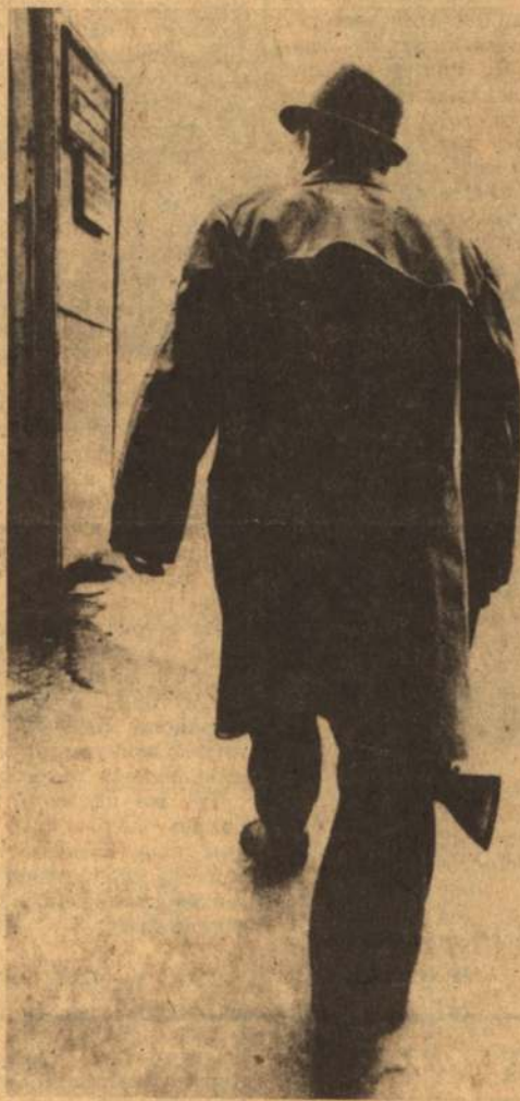
ВЫШЛИ ИЗ ОКОПОВ...