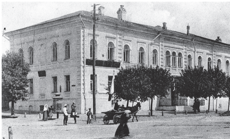
Здание Белгородской городской управы.