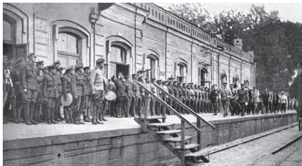
Парад Марковского полка в честь прибытия генерала А.И. Деникина, Белгород, 1919г.

1 сентября городская управа постановила организовать комитет по сбору