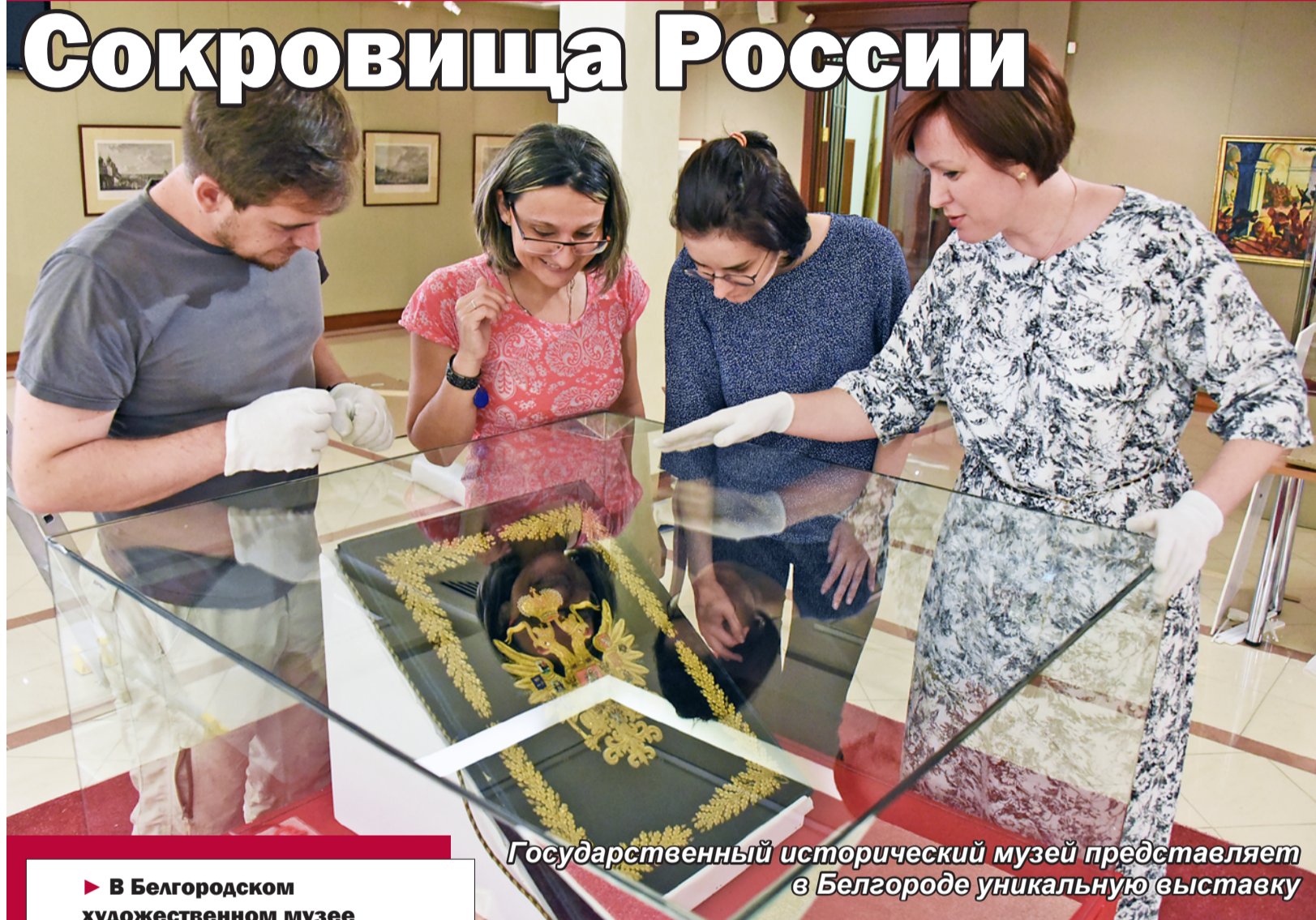
Государственный исторический музей представляет в Белгороде уникальную выставку