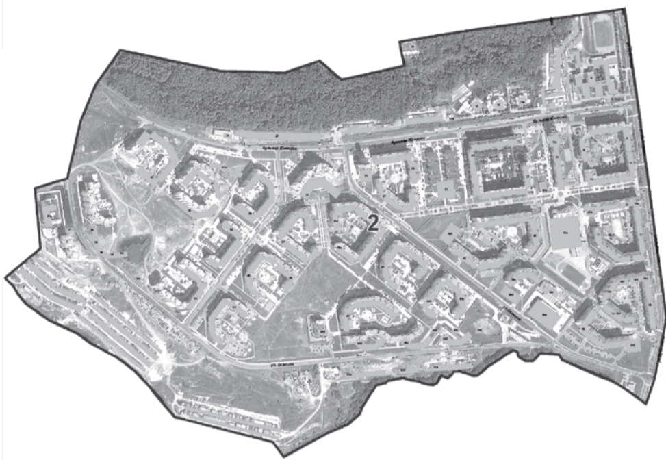
Бульвар Юности - от улицы Буденного до конца - нечетная и четная стороны. Улицы: Буденного - от дома №4 до конца - четная сторона; Есенина - от улицы Буденного до конца - четная сторона; Конева - дома №№27,27А».

Л.Н. КАЛАБИНА председатель Избирательной комиссии города Белгорода