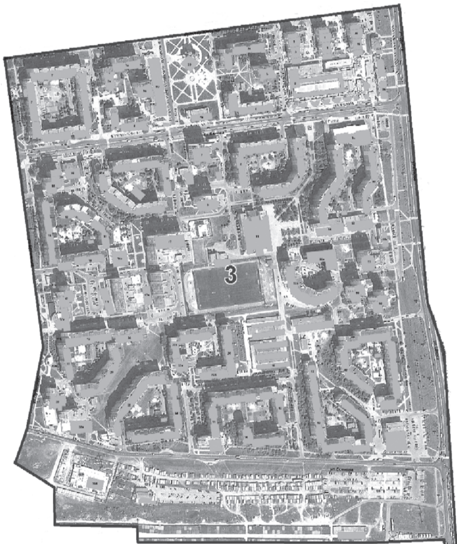
Бульвар Юности - от начала до улицы Буденного - нечетная сторона. Улицы: Буденного - от бульвара Юности до конца - нечетная сторона; Есенина - от улицы Щорса до улицы Буденного - четная сторона; Конева - от начала до улицы Буденного - нечетная и четная стороны; Щорса - от бульвара Юности до конца - четная сторона.

Л.Н. КАЛАБИНА председатель Избирательной комиссии города Белгорода