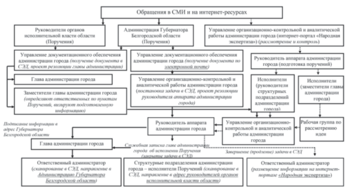
Схема регистрации, прохождения, контроля, исполнения обращений, размещенных в СМИ и на интернет-ресурсах, поступающих на рассмотрение в администрацию города

Приложение 2 к распоряжению администрации города от 29 декабря 2018 г. № 1323