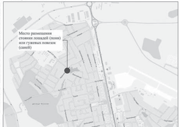
Приложение №2 к схеме размещения мест для оказания услуг по катанию на лошадях (пони) или гужевых повозках (санях) на территории города Белгорода