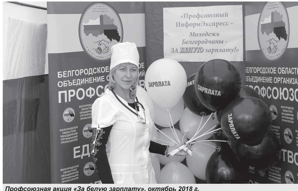
Профсоюзная акция «За белую зарплату», октябрь 2018 г.

В 1992 году по инициативе областного совета профсоюзов был принят закон о коллективных договорах и соглашениях. Самая массовая общественная организация стала влиятельной и авторитетной силой в области.