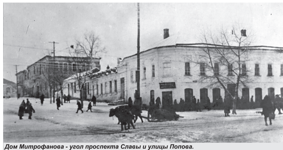
Дом Митрофанова - угол проспекта Славы и улицы Попова.