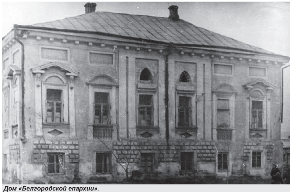
Дом «Белгородской епархии».

Александр ЛИМАРОВ ФОТО ИЗ ЛИЧНОГО АРХИВА АВТОРА