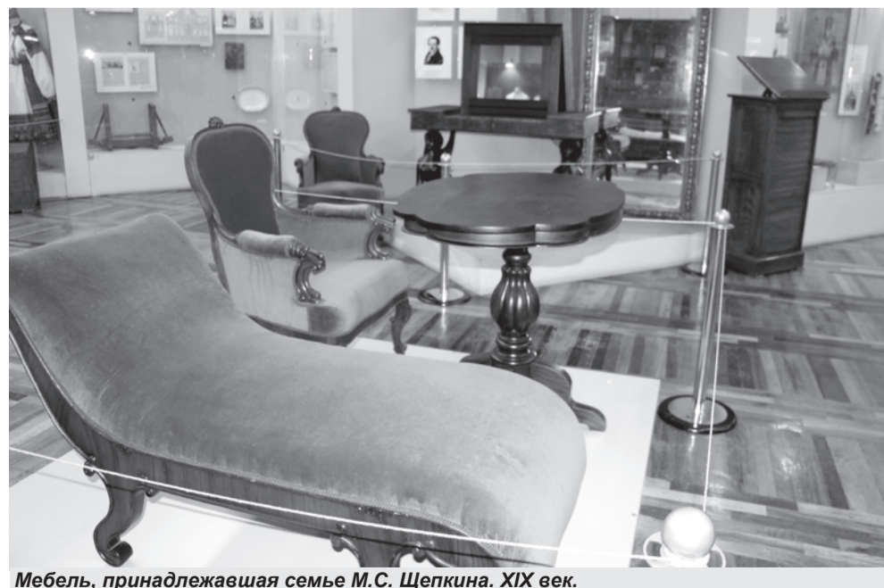
Мебель, принадлежавшая семье М.С. Щепкина. XIX век.