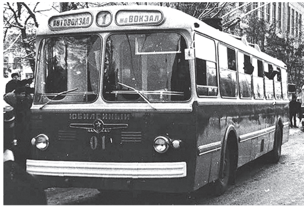
Первый городской троллейбус. 1967 г.

А что думают белгородцы по поводу электротранспорта? Нужен ли он городу и