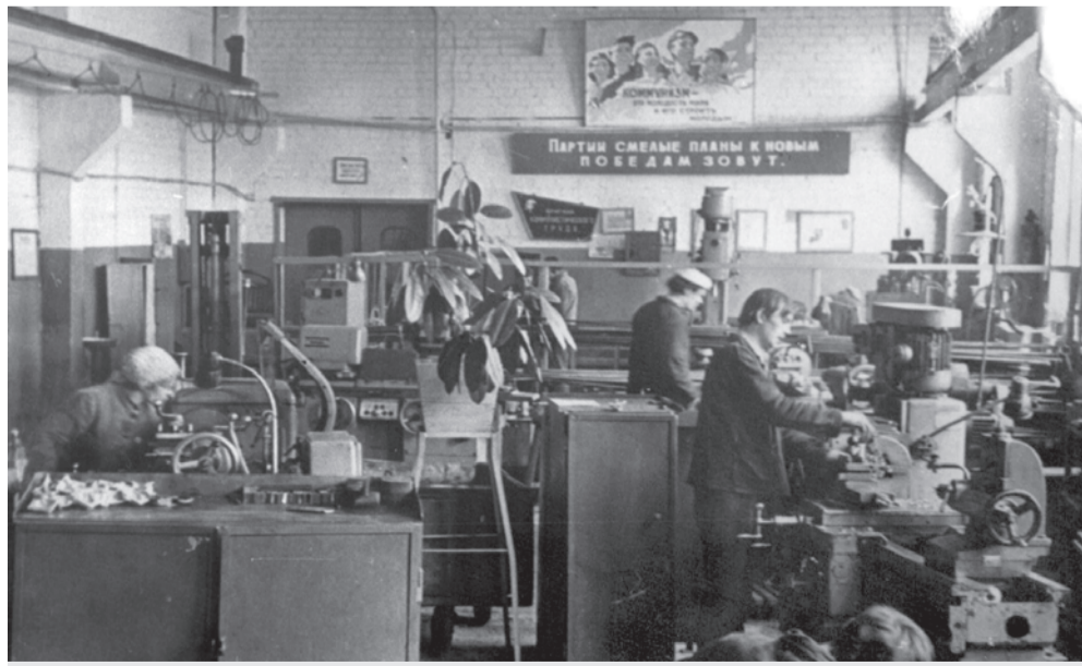
Троллейбусное депо Белгорода. 1970 г.

К первому дню рождения молодого предприятия здесь появились еще 12 машин. Для сравнения: в 1989 году на балансе числилось 153 троллейбуса, успешно перевозившие пассажиров во всех направлениях. «Рогатые» были вместительнее и комфортнее стареньких ЗИСов и ЛАЗов, ездили часто, поэтому жители областного центра