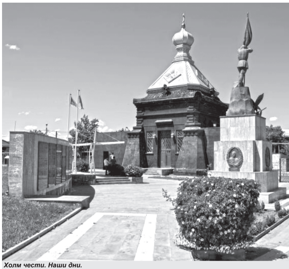
Холм чести. Наши дни.

и был награжден памятной медалью «За усмирение мятежа в Венгрии и Трансильвании в 1849 году». В 1853 году он вступил в командование 7-м эскадром и произведен в капитаны.