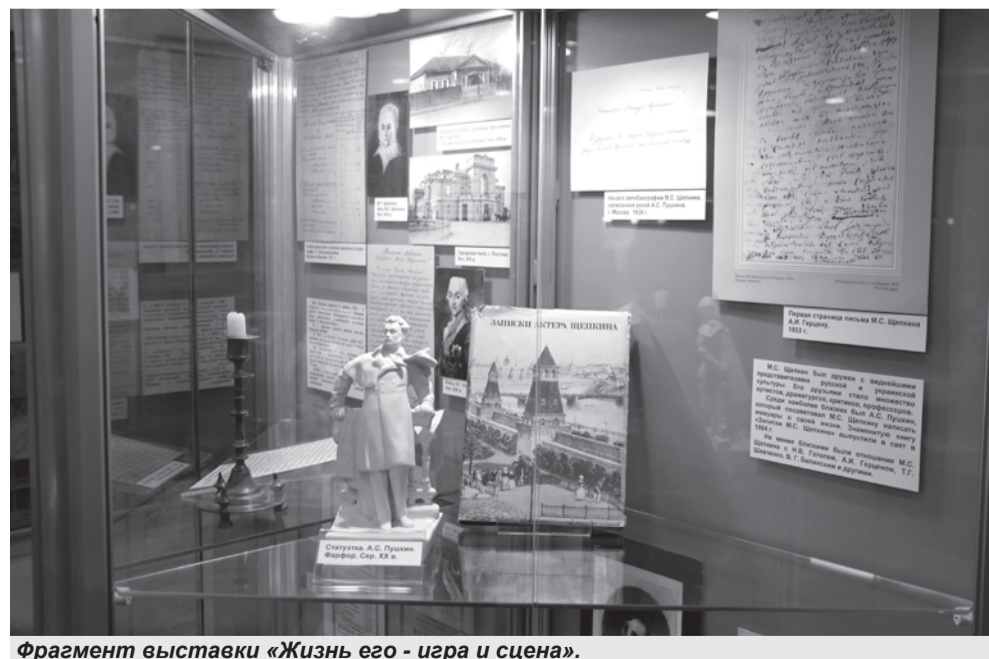
Фрагмент выставки «Жизнь его - игра и сцена».