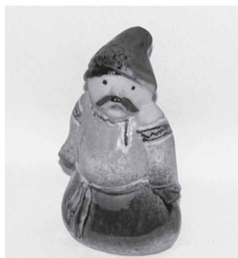
Статуэтка М.С. Щепкин в роли Чупруна пьесы И. П. Котляревского «Солдат-чародей», п. Борисовка. XX век.

лист дворовому человеку М.С. Щепкину 1821 г.».