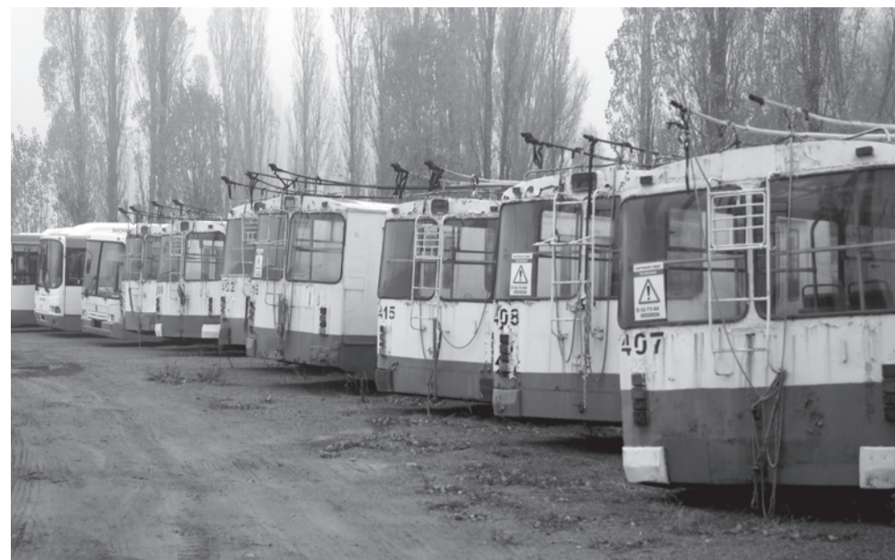
Троллейбусный парк. Наши дни.

быстро оценили преимущества троллейбусов и с удовольствием пользовались их услугами. В 1968 году, например, троллейбусы перевезли более 12 миллионов белгородцев. Электротранспорт ездил с 5 часов утра до часа ночи.