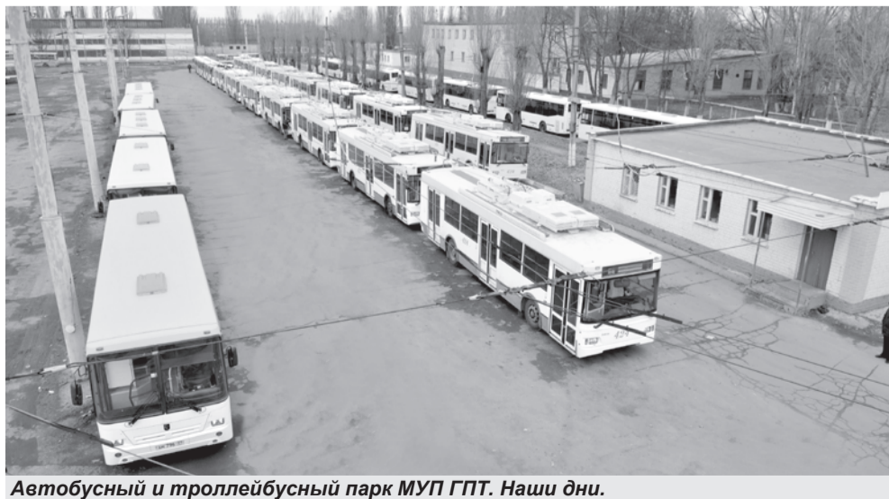
Автобусный и троллейбусный парк МУП ГПТ. Наши дни.

И автобусам, и троллейбусам, и трамваям есть еще одна альтернатива, которая становится все более привлекательной не только в России. Речь - об электробусах. Что это такое и с чем их едят, крупные мировые производители