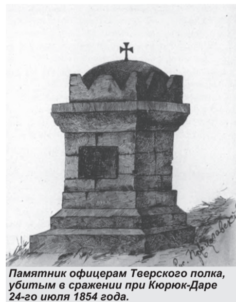
Памятник офицерам Тверского полка, убитым в сражении при Кюрюк-Даре 24-го июля 1854 года.