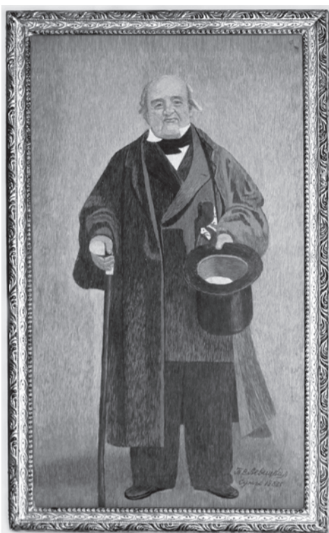
Портрет М.С. Щепкин, г. Сумы. 1983 год.

Театральную карьеру юный Щепкин продолжил в Курске, затем в Харькове и Полтаве. Долгие гастроли в этих городах помогли ему в дальнейшем показать российскому зрителю настоящую живую Малороссию через роль Чупруна в пьесе «Солдат-чародей» украинского классика И.П. Котляревского. Эта пьеса, вошедшая в сокровищницу украинской культуры, была написана специально для Щепкина, и вошла в число самых замечательных работ актёра. Поэтому художники часто изображали Михаила Семеновича в этом образе. На выставке представлена статуэтка XX века «М.С. Щепкин в роли Чупруна».