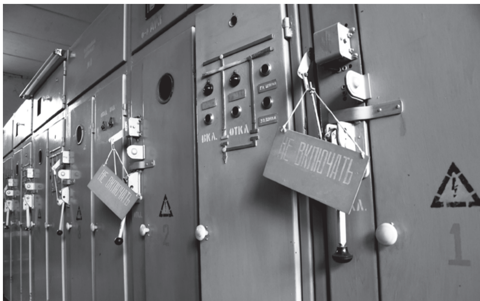
Тяговая подстанция. Наши дни.