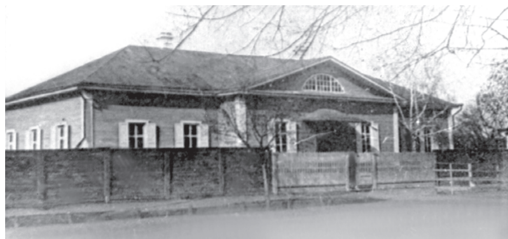
Училище в Судже Курской губернии, где учился М.С. Щепкин с 1799 по 1801 годы.

Очень важным событием в его жизни является освобождение от крепостной зависимости. Благодаря губернатору, князю Н.Г. Репнину и будущему декабристу, князю С.Г. Волконскому, в 1821 году Михаил Щепкин становится свободным человеком, что подтверждает «отпускной