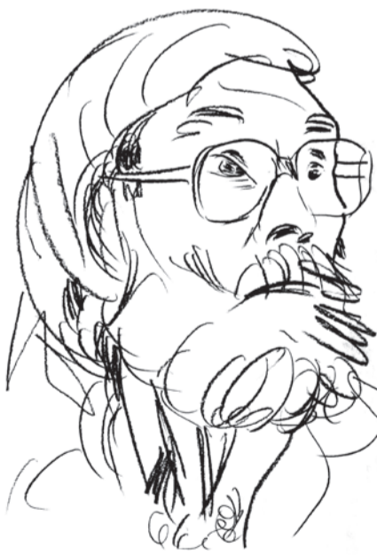
РИСУНОК БОРИСА ЕВЧИНА

Галерею его иконописных работ в альбоме открывает репродукция иконы