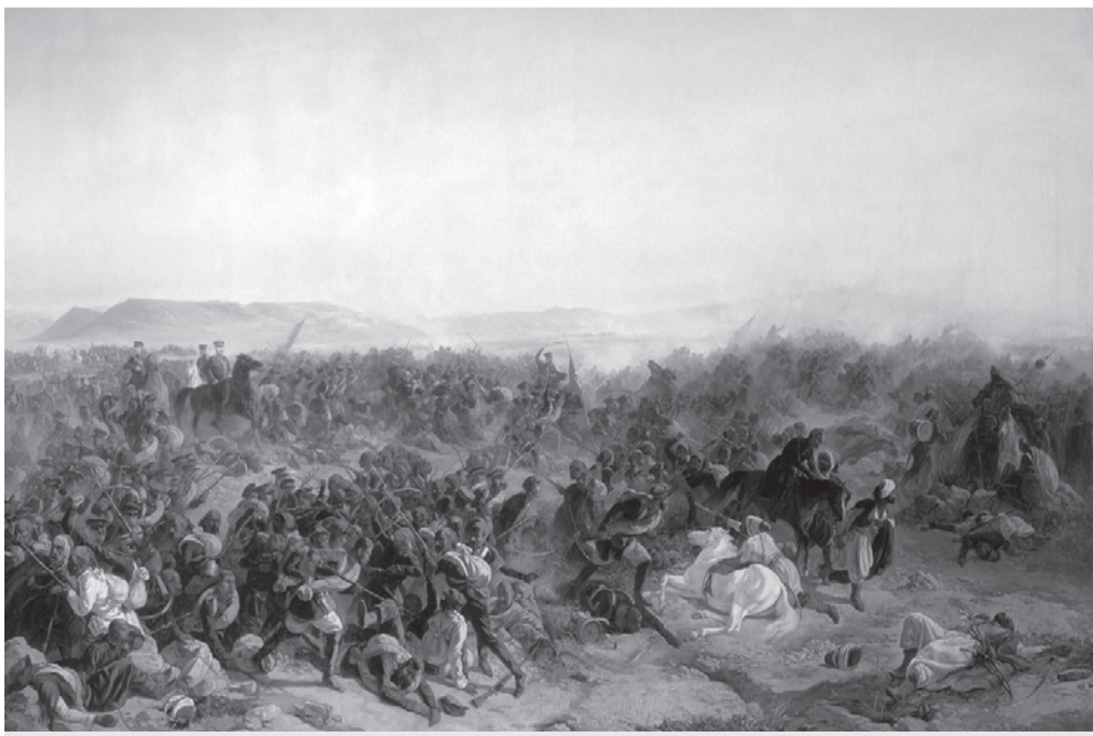
Сражение при Кюрюк-Даре. Художник Рубо.