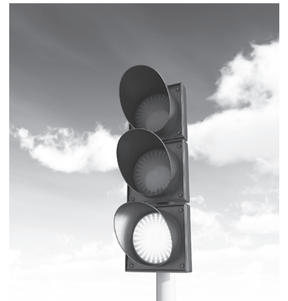
Константин МЫШКИН ФОТО ИЗ СВОБОДНЫХ ИСТОЧНИКОВ

В последнее время в Белгороде появились перекрестки, на которых красный сигнал светофора загорается во всех направлениях, тем самым останавливая движение транспорта. Никита Черненко пояснил: «Такой режим работы светофора введен в соответствии с новым ГОСТом. Сделано это для того, чтобы разделить пешеходные и транспортные потоки для обеспечения безопасности. Пока в Белгороде семь таких перекрестков. Они были отобраны экспертами ГИБДД по показателям аварийности с участием пешеходов. После перевода светофора на новый режим работы подобные ДТП здесь не зафиксированы».