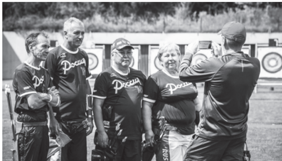
Полосу подготовил Андрей ЮДИН

У мужчин Юрий Леонтьев показал лучший результат среди россиян, заняв пятое место. Станислав Забродский не смог удержать лидерство, с третьим местом по итогам квалификации и солидными 648 очками в итоге уступил францу Ализаде Бабаку в 1/8. Константин Эрдыниев остановился на 17-й позиции.