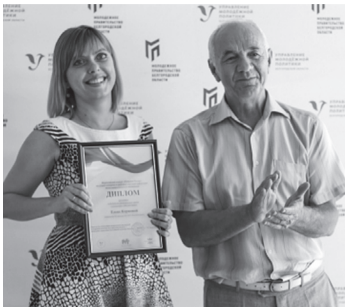
ФОТО ПРЕСС-СЛУЖБЫ УПРАВЛЕНИЯ МОЛОДЕЖНОЙ ПОЛИТИКИ БЕЛГОРОДСКОЙ ОБЛАСТИ