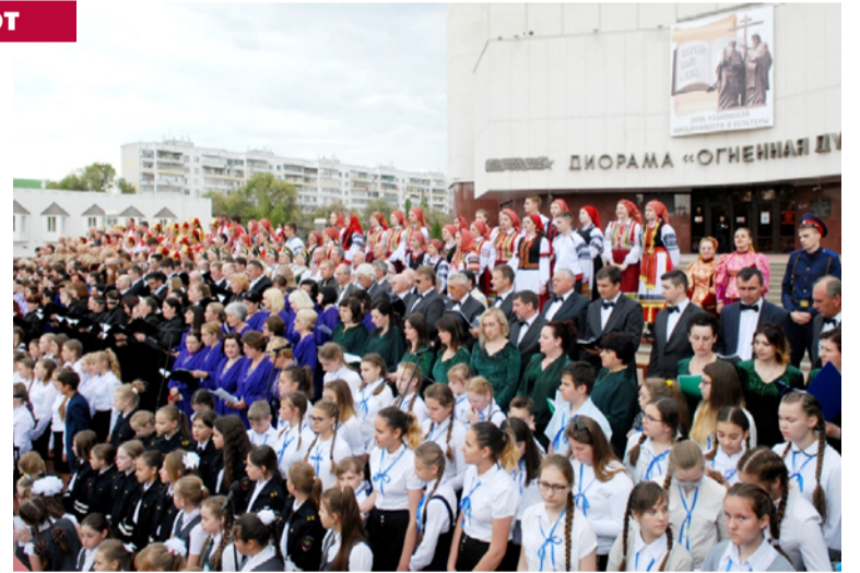
Концерт состоится 20 мая у музея-диорамы, начнётся в 17.00.

Программа будет сопровождаться концертным оркестром духовых инструментов, инструментальной группой ансамбля песни и танца «Белогорье» Белгородской государственной филармонии.