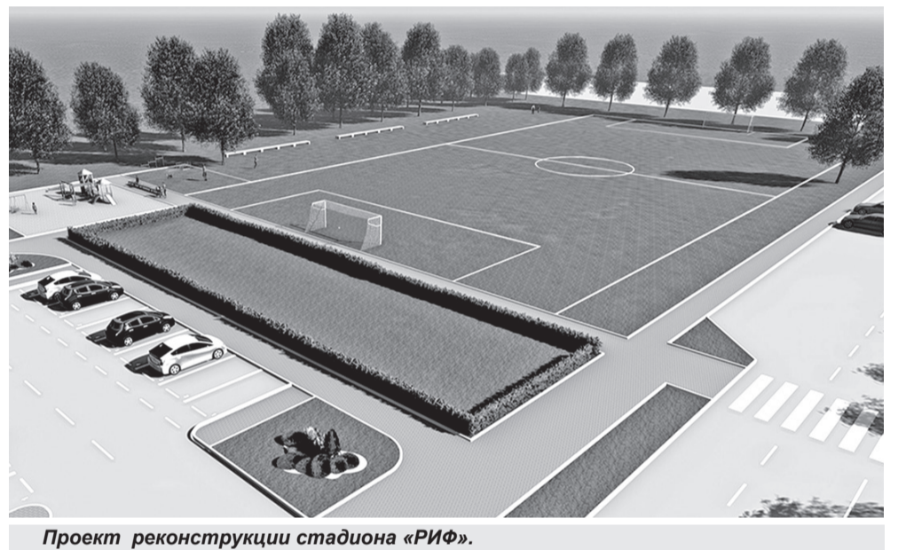
Проект реконструкции стадиона «РИФ».

Жители дома по пр. Богдана Хмельницкого, 148, во дворе которого в прошлом