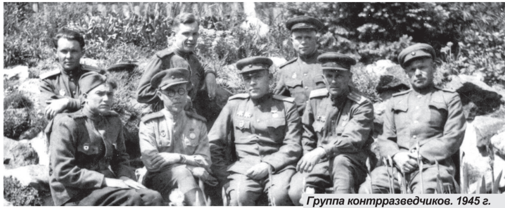
Группа контрразведчиков. 1945 г.