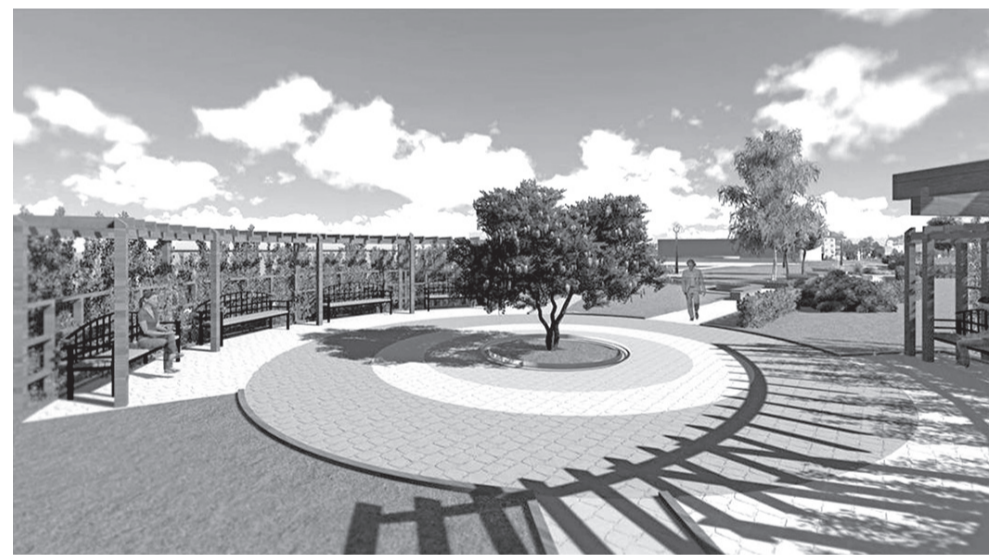
Дизайн-проект благоустройства сквера им. В.М. Рязанова.