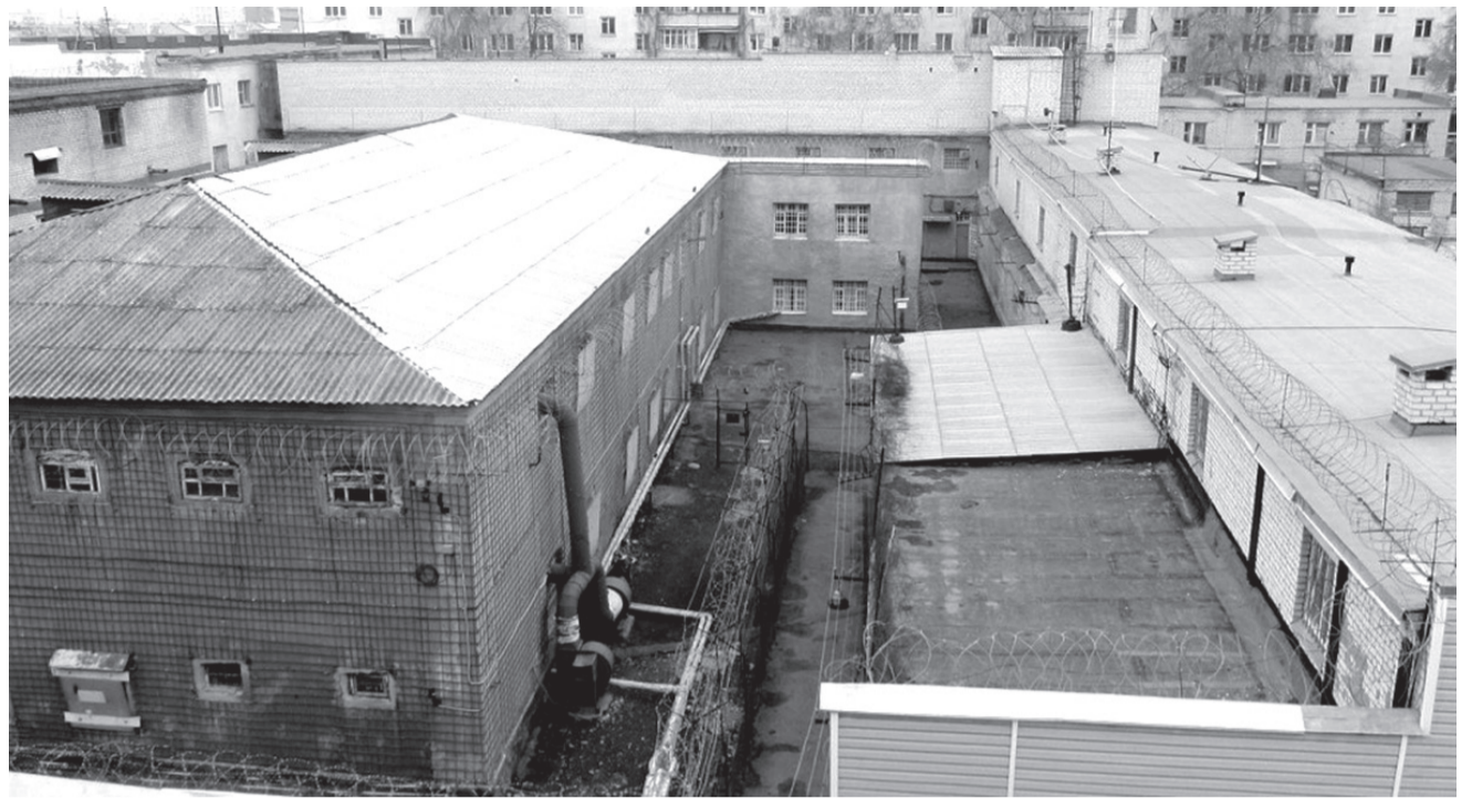
Тюрьма в наши дни. Здание снесено в 2017 году.

► Срок аренды тюремного здания истекал, и вопрос о постройке новой тюрьмы опять остро встал перед городскими властями и тюремным управлением. В этот раз было предложено перенести тюремный замок в бывший этапный дом.