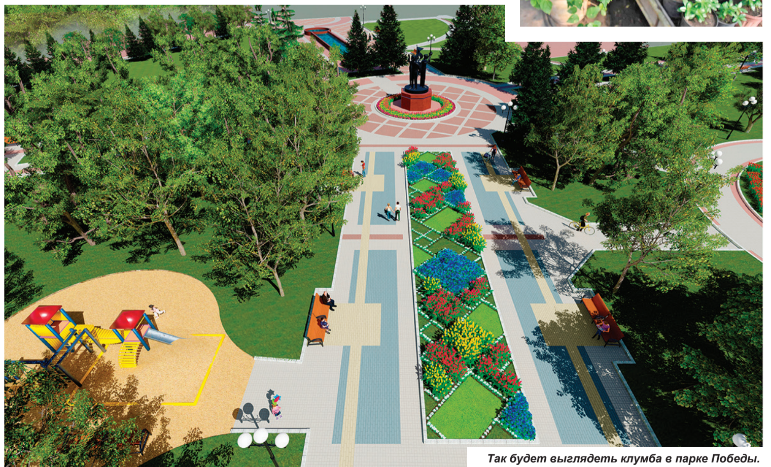
Так будет выглядеть клумба в парке Победы.

Первыми на клумбы отправляются «стойкие солдатики»: бархатцы и петунии. Они наиболее устойчивы к смене температур и могут перенести похолодание. Агрономы выжидают установление среднесуточной температуры воздуха 10-15 градусов тепла, чтобы избежать массовой гибели цветов. Те,