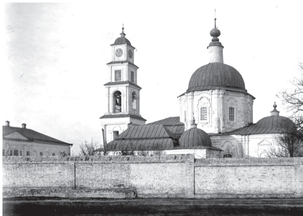
Усадьба бывшего Николаевского монастыря.

И все же к идее разместить здание тюрьмы на бывшем этапном месте пришлось вернуться. Строения этапного места представляли собой казармы и их древность - это тоже краеведческий миф. На самом деле построены они были не