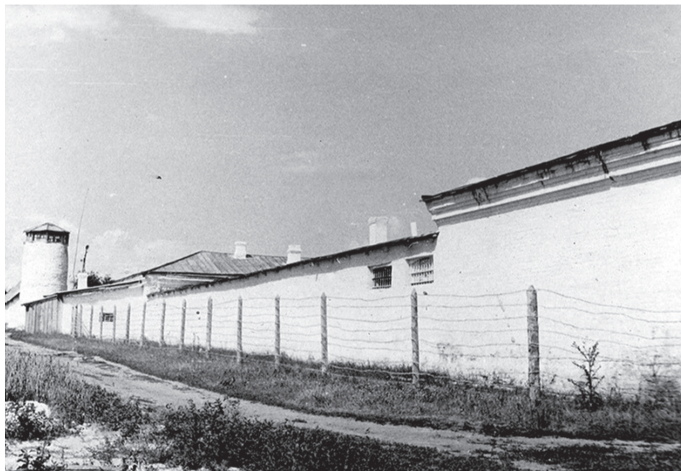
Тюремный замок после 1890 года.