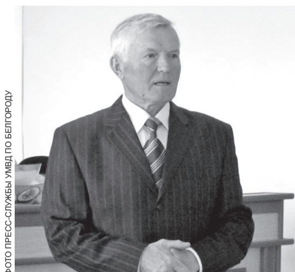
ФОТО ПРЕСС-СЛУЖБЫ УМВД ПО БЕЛГОРОДУ

17 апреля - День ветеранов органов внутренних дел и внутренних войск МВД России