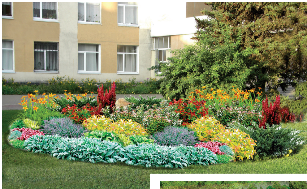
Проект клумбы с использованием многолетних растений возле музыкального училища.

Опыт прошлого года показал, что жителям и гостям Белгорода особенно нравятся цветники с использованием гравийной отсыпки и природного камня, поэтому этим летом таких композиций станет больше. Они будут разбиты по Белгородскому проспекту, на пересечении Богданки и улиц Урожайной, Студенческой, на перекрестке ул. Волчанской и Белгородского полка.