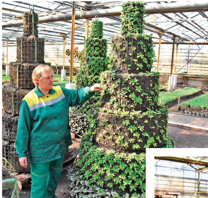
Сотрудники тепличного комплекса готовят цветы к высадке.

Горшки с живыми украшениями выставляют в местах, где невозможно высадить растения в грунт. В холодное время года контейнер либо убирают в теплицу, либо переставляют в другое место, чтобы он не мешал уборке тротуара.