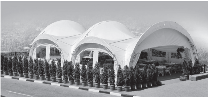
14. Типовое решение внешнего вида нестационарного торгового объекта – сезонное кафе, размещаемого на территории городского округа «Город Белгород»

Шатер, ротанговая мебель, вазоны с хвойниками, кашпо с цветами