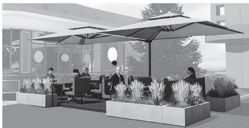
17. Типовое решение внешнего вида нестационарного торгового объекта – сезонное кафе, размещаемого на территории городского округа «Город Белгород»

Зонты, деревянный подиум, деревянная мебель, вазоны с цветами