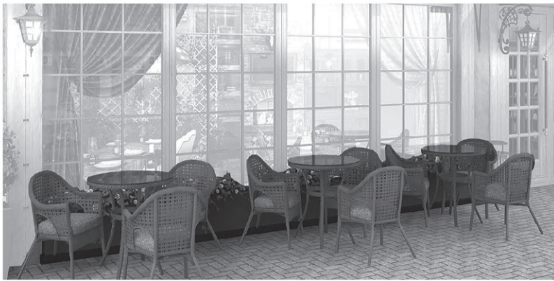
13. Типовое решение внешнего вида нестационарного торгового объекта – сезонное кафе, размещаемого на территории городского округа «Город Белгород»