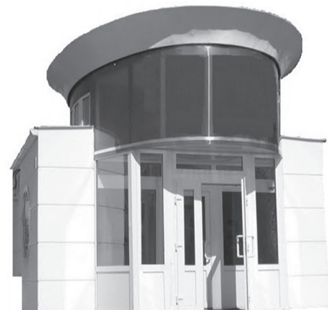
Распоряжение от 16.03.2018г. №316 «О проведении торгов по продаже права на заключение договора на размещение нестационарного торгового объекта – павильона по реализации питьевой воды по ул. Челюскинцев, 58»