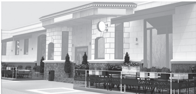
15. Типовое решение внешнего вида нестационарного торгового объекта – сезонное кафе, размещаемого на территории городского округа «Город Белгород»

Маркизы, деревянный подиум, ротанговая мебель, кашпо с цветами, вазоны с хвойниками