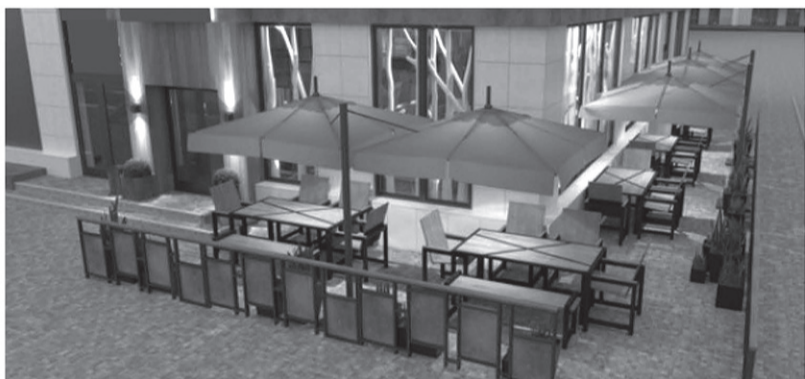
16. Типовое решение внешнего вида нестационарного торгового объекта – сезонное кафе, размещаемого на территории городского округа «Город Белгород»

Зонты, деревянная мебель, вазоны с хвойниками