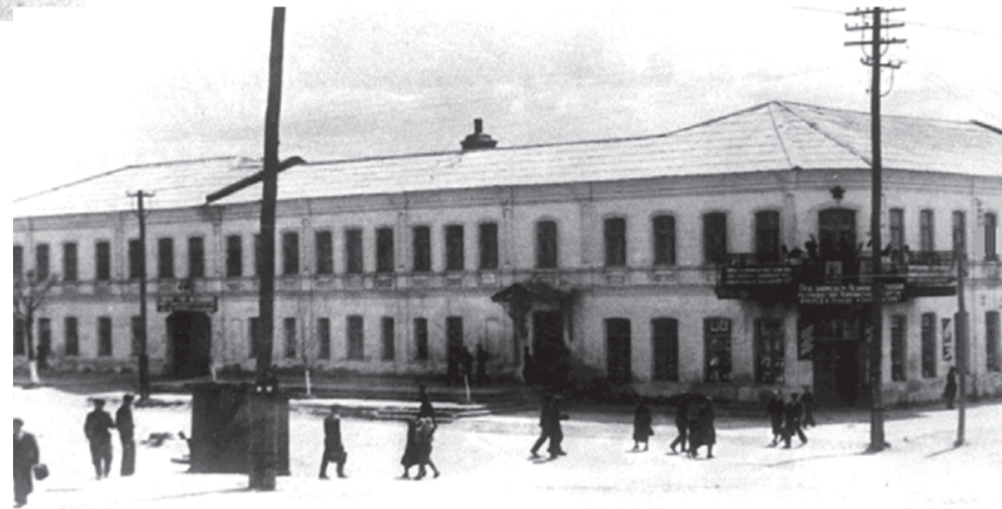
Здание медучилища. Конец 30-х годов.

► На протяжении веков город-крепость Белгород был одним из главных оборонительных форпостов рубежей нашего государства. Одним из самых страшных испытаний в истории города и всей нашей страны стала Великая Отечественная война. Белгород стал местом нескольких ключевых сражений, пережил годы гитлеровской оккупации. Эти события навсегда останутся в нашей памяти и в наших сердцах.