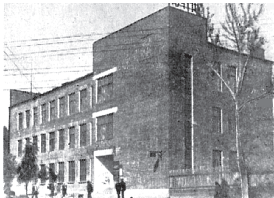
Здание Белгородского почтамта. Конец 30-х годов.

чалом войны Белгород располагал городской больницей на 350 мест, больницей железнодорожного узла на 320 мест, двумя поликлиниками на 24 врачебных кабинета и другими медицинскими учреждениями. На территории города имелось два парка площадью 36 гектаров, три благоустроенных сквера, три городских сада с киноплощадками, два кинотеатра, драматический театр на 700 мест. Активной и полнокровной жизнью жил Белгород накануне Великой Отечественной войны.