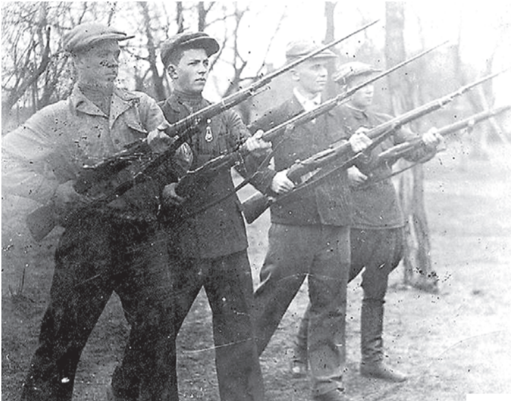
Белгородцы на занятиях по военной подготовке. Конец 30-х годов.

9 ФЕВРАЛЯ 1943 года, ровно 75 лет назад, Белгород был первый раз освобожден от гитлеровских захватчиков.