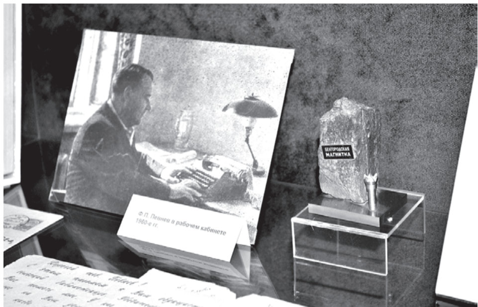
ФОТО ИЗ ФОНДОВ МУЗЕЯ

Его называли летописцем Курской магнитной аномалии