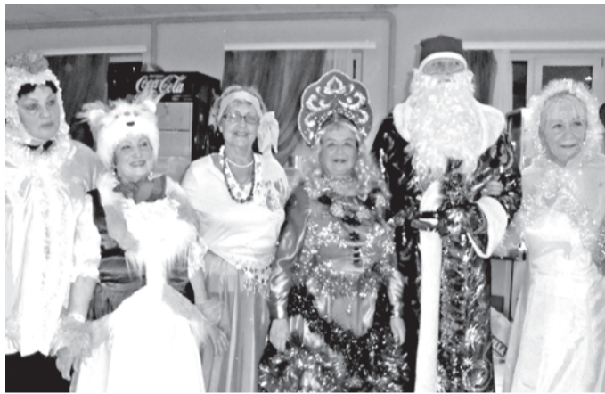
ФОТО ВОИ ЗАПАДНОГО ОКРУГА Г. БЕЛГОРОДА

► Новый год уже уверенно шагает по стране. А мы, активисты Всероссийской организации инвалидов из Западного округа Белгорода, с теплом вспоминаем, какой замечательный подарок преподнесли нам к этому празднику.