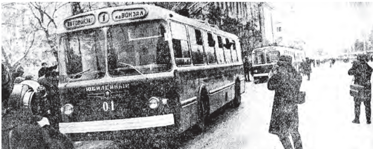
Белгородский троллейбус отправляется в путь.