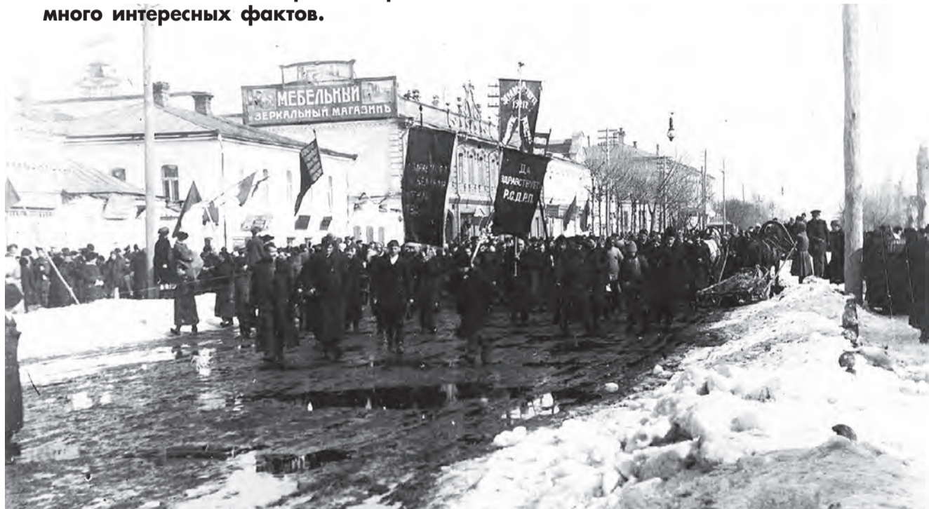
Революционная манифестация в Белгороде.

- Начать, наверно, надо с того, что важнейшую роль в октябрьских событиях 1917 года в Белгороде сыграли поляки. В Белгороде с конца 1916 года был размещен польский запасной полк. Во время Первой мировой войны еще царским правительством было принято решение создавать национальные части из представителей тех национальностей, чьи земли были оккупированы немецкими войсками. Это были поляки, латыши, эстонцы. Считали, что они будут лучше воевать, стараться вернуть свои родные территории. Белгороду достались поляки. И к лету 1917 года это уже был не полк, и даже не дивизия. Число их достигло ни много ни мало 17 тысяч человек. Кто-то был призван только что, кто-то уже понюхал пороха. И вот именно эта вооруженная сила стала залогом того, что Белгород стал единственным городом в Курской губернии, где советская власть была установлена быстро и без кровопролития.