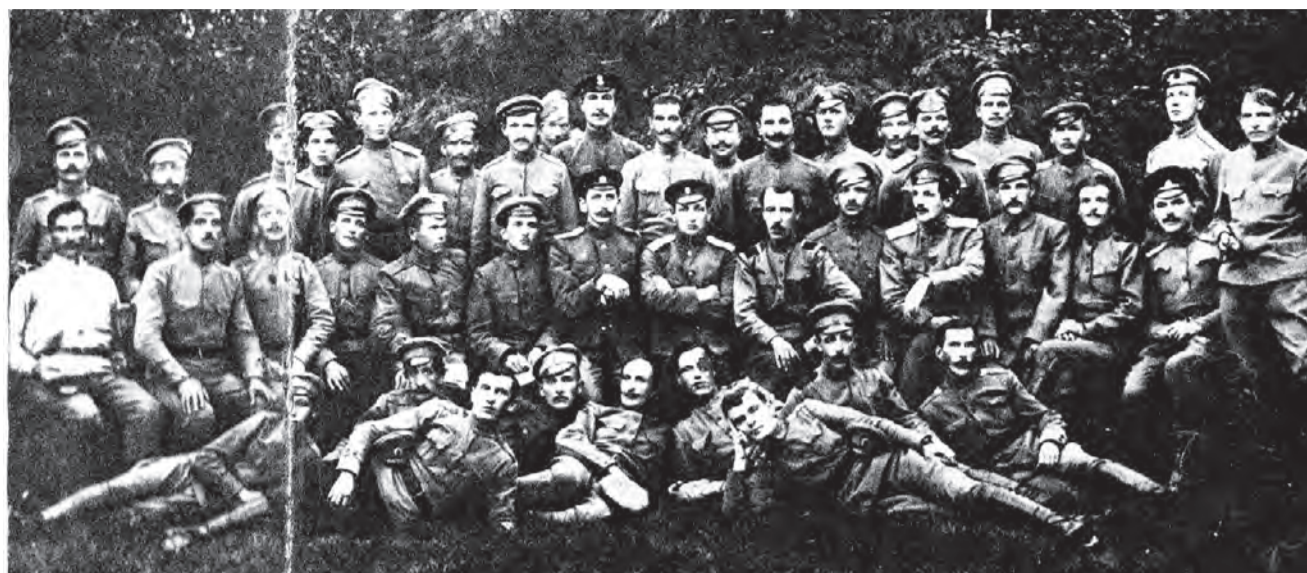
Полковой комитет польского запасного полка.