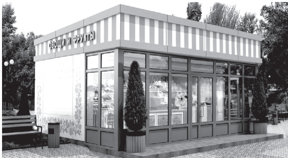
Комитет имущественных и земельных отношений администрации г. Белгорода сообщает о проведении 29 сентября 2017 г., в 11 часов, аукциона по продаже права на заключение договоров на размещение нестационарных торговых объектов в составе остоновочных комплексов согласно следующим лотам:

Типовое решение внешнего вида нестационарного торгового объекта – павильона по реализации овощей и фруктов, размещаемого на территории городского округа «Город Белгород»