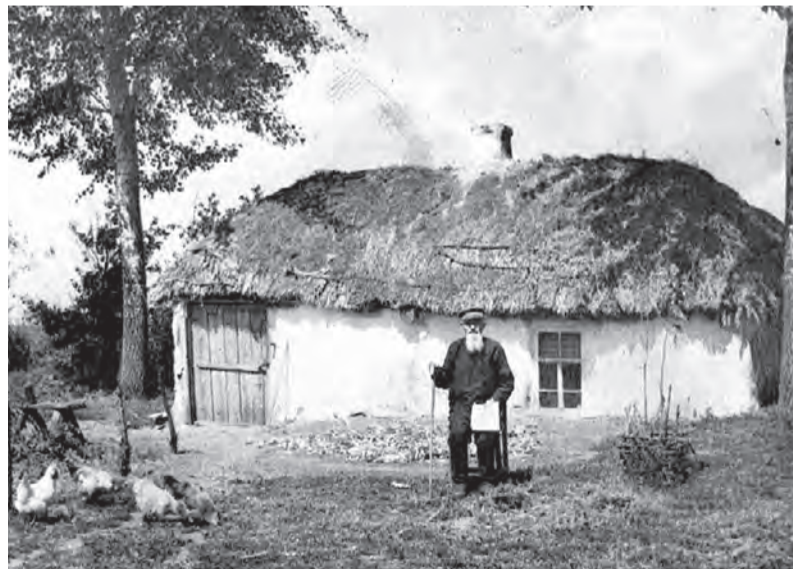
Хата под соломенной крышей.