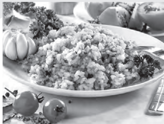
рис - 0,5 стакана, гречка - 0,5 стакана, пшено - 0,5 стакана, лук - 2 шт., морковь - 2 шт., кабачок, грибы, сливочное масло - 100 гр., вода - 3,5 стакана, соль, специи, зелень.