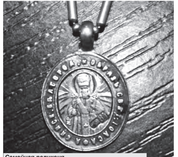
Семейная реликвия - образ святого Иоасафа Белгородского.