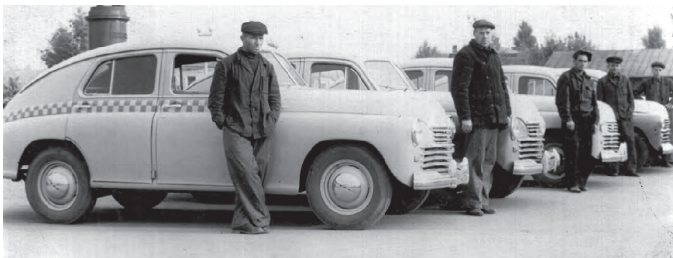
Первые белгородские такси на Привокзальной площади (1957 год).

Шестьдесят лет назад в Белгороде появились первые такси