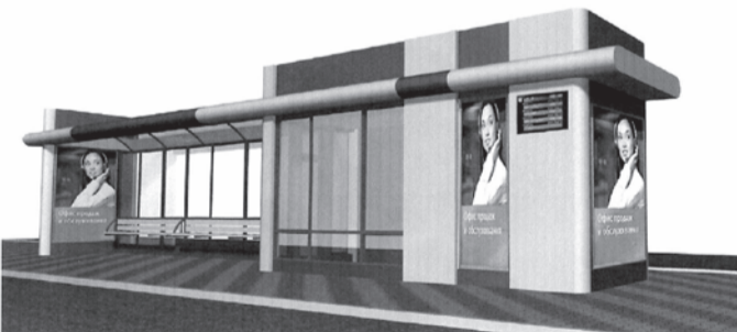
Вариант 2. Типовое решение внешнего вида нестационарного торгового объекта – павильона (киоска) в составе остановочного комплекса, размещаемого на территории городского округа «Город Белгород»