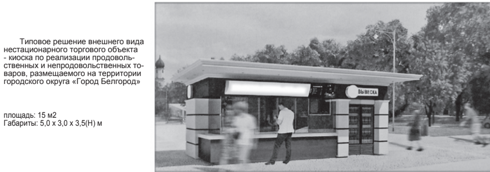
площадь: 15 м 2 Габариты: 5,0 x 3,0 x 3,5(Н) м

1). Управление: 2) Исполнитель: адрес: _____ адрес: _____ ИНН _____ ОГРН _____ банк _____ ИНН _____ банк _____ ИНН _____ М.П. _____ М.П. _____