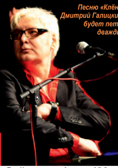
Песню «Клён» Дмитрий Галицкий будет петь дважды

Концерт состоится 4 марта в 19.00 в ДК «Энергомаш» (г. Белгород, пр. Б. Хмельницкого, 78Б) Цена билетов – 700–2500 руб. Телефоны для справок: +7(4722) 37-48-49, 37-54-54, +7-910-051-50-80