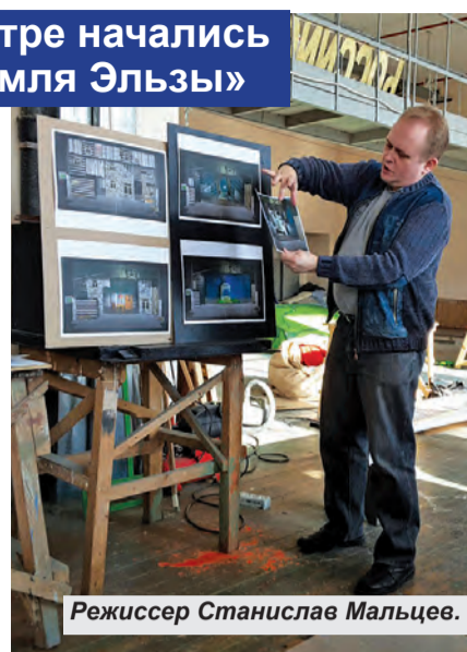
Режиссер Станислав Мальцев.