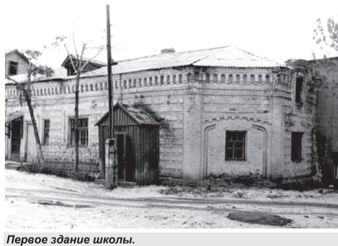
Первое здание школы.