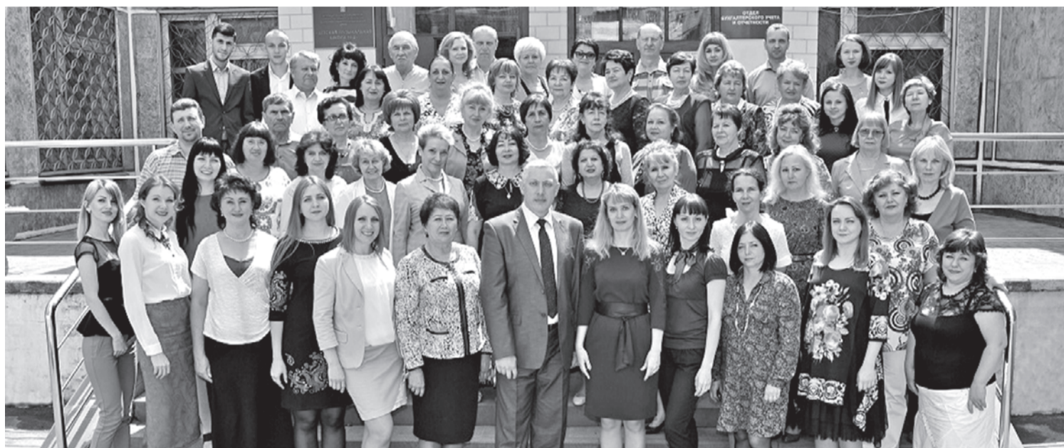
Коллектив школы сегодня.