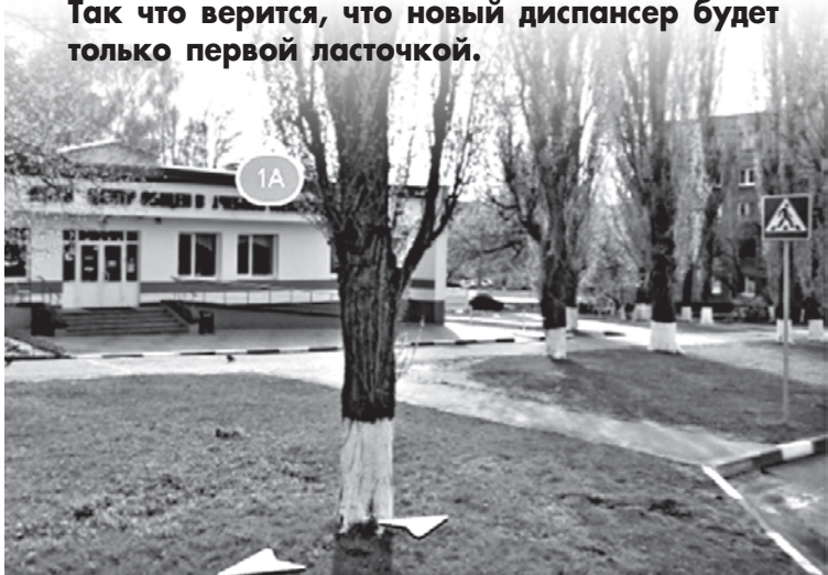
ФОТО МАРИИ СЕРГЕЕВОЙ

► В первом квартале 2017 года в Белгороде начнет свою работу лечебно-физкультурный диспансер. Спортсмены и просто любители спорта смогут получать качественное медицинское обслуживание. В диспансере расположатся отделения врачебного контроля и лечебной физкультуры, спортивной медицины, функциональной и лабораторной диагностики, физиотерапии. Напомним, что воссоздание системы лечебно-физкультурных диспансеров в стране началось после принятия в 2012 году соответствующей президентской программы. По положению один диспансер должен приходиться на 500 тысяч жителей. Так что верится, что новый диспансер будет только первой ласточкой.