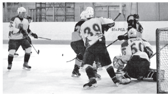
ФОТО ОФИЦИАЛЬНОЙ ГРУППЫ МХК «ЛИПЕЦК» ВКОНТАКТЕ

Напомним, белгородцы также победили в товарищеских матчах с Дмитриевым и Зеленоградом. Следующие контрольные встречи «Белгород» проводит в Воронежской области против «Россоши» 18 и 19 августа.