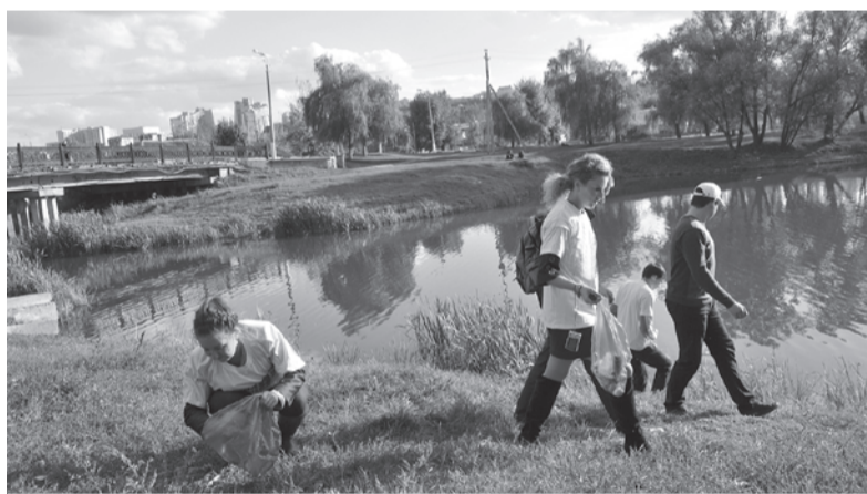
Экологический субботник на Везелке.

- Очень многое. Русское географическое общество внесло крупнейший вклад в изучение Европейской России, Урала, Сибири, Дальнего Востока, Средней и Центральной Азии, Кавказа, Ирана, Индии, Новой Гвинеи, Арктики и других территорий. Эти исследования связаны с именами известных путешественников Николая Северцова, Николая Пржевальского, Петра