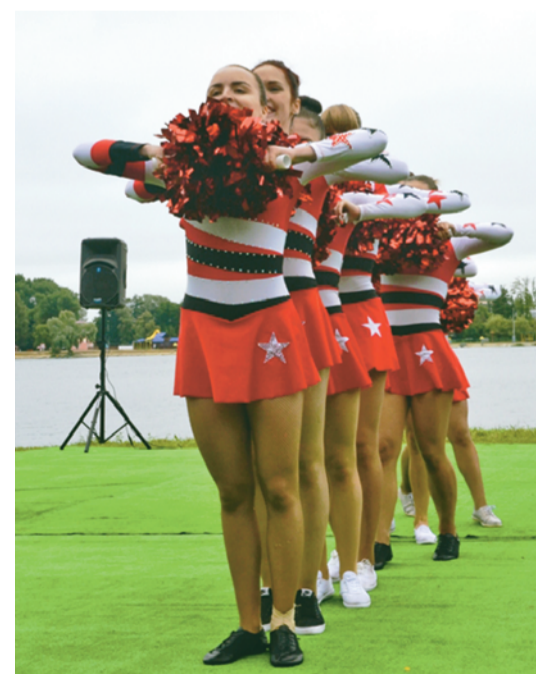
Алина АЛЕКСАНДРОВА ФОТО АВТОРА