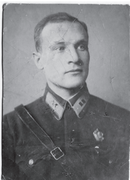
Герой Советского Союза П.П. Десницкий, лейтенант, стрелок-радист. 1937 г.

Есть в истории Белгородчины люди, которые хотя и не являются нашими земляками, но неразрывно связаны с историей нашего края. Многие из них воевали в Испании, и отличились во время Курской битвы при освобождении Белгородчины от немецко-фашистских захватчиков в июле-августе 1943 года.