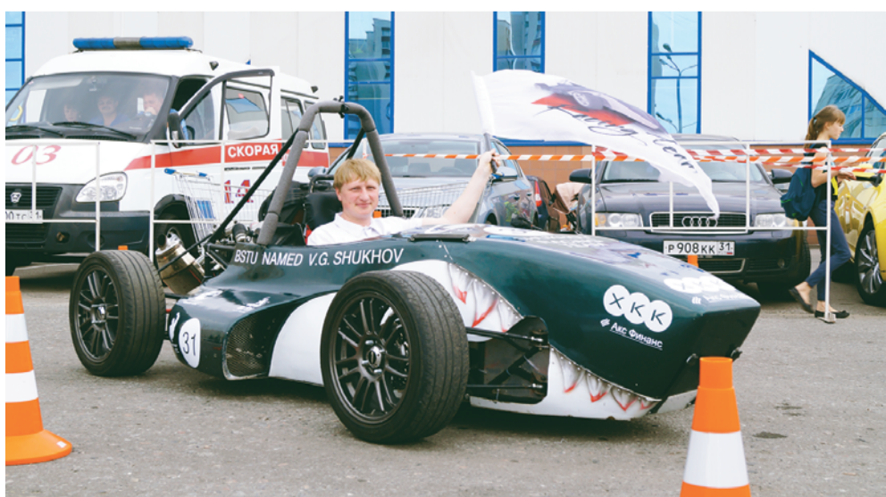
«Шухов Рэсинг Тим» возле киноцентра «Русич».