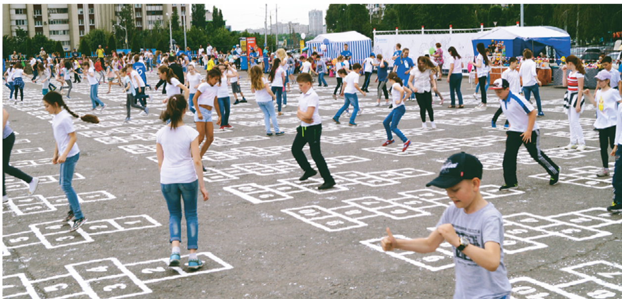
Город играет в классики.