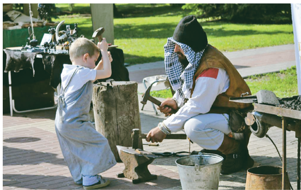
Кузнецы: молодой и опытный.