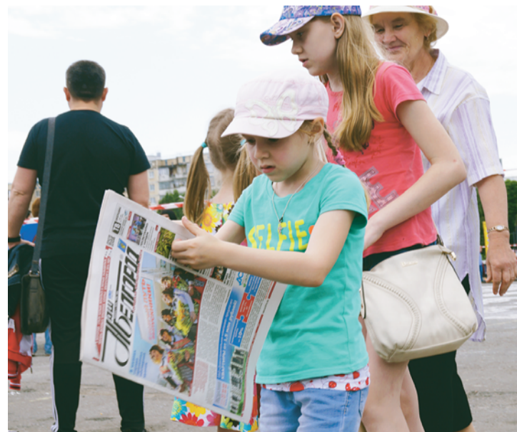
«Наш Белгород» читают стар и млад.