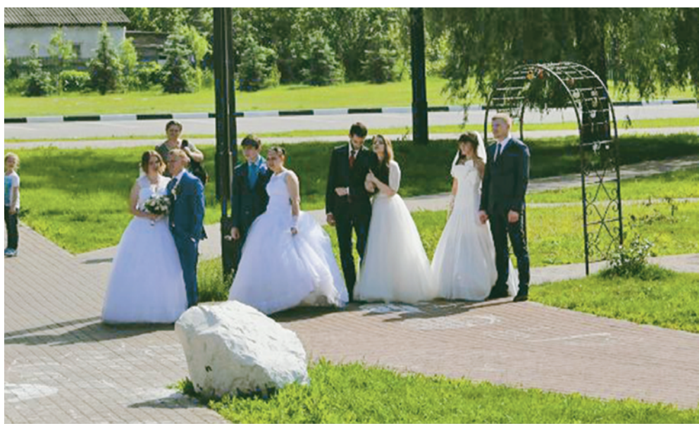
Женихи и невесты на Аллее любви.