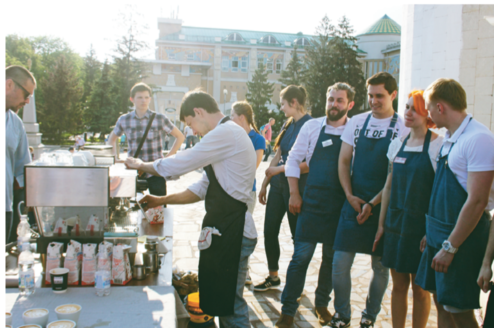
Конкурс кофейных сомелье.