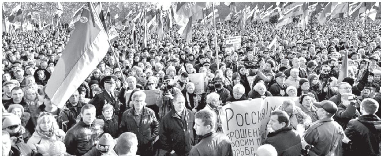
Севастополь, митинг 23 февраля 2014 года.