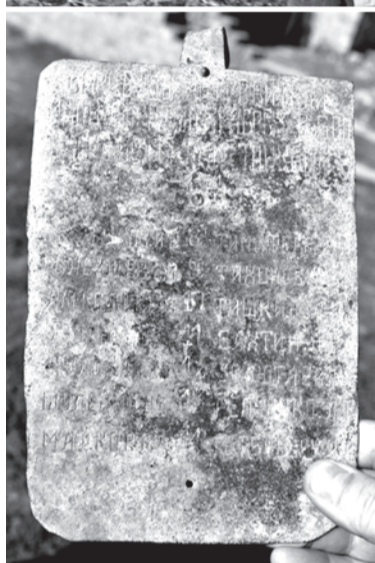
Та самая печная заслонка с выбитыми на ней фамилиями.