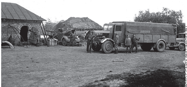
Гриневка в период оккупации. 1942 г.