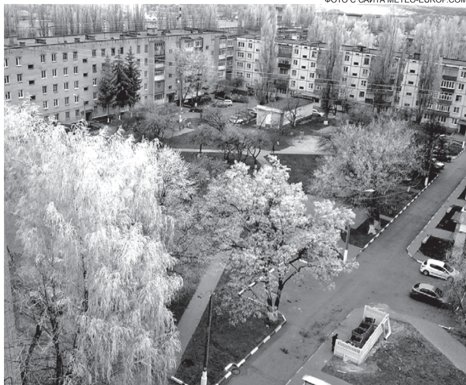
Один из дворов современной Гриневки.