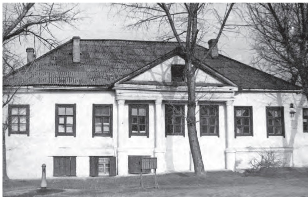
1980-Е ГОДЫ.