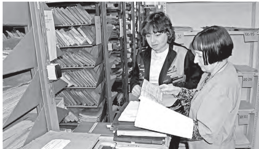
Повседневный труд работников архива.

Архивы красиво называют хранилищами исторической памяти, поскольку в них собрано много уникальной и полезной информации с древних времен и до наших дней. В них постоянно кипит своя напряженная и кропотливая работа, и архивные работники ни минуты не сидят без дела. Сегодня мы расскажем о работе ОГКУ «Государственный архив новейшей истории Белгородской области», отметивший на днях свое 5-летие.