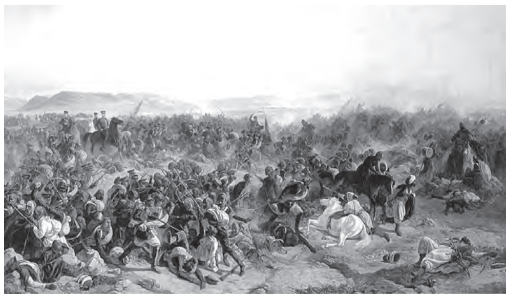
КАРТИНА Ф.И. БАЙКОВА «БОЙ С ТУРКАМИ ПРИ СЕЛЕ КЮРЮК-ДАРА».

ми и переулками. Эта интересная деталь поможет в дальнейшем определить искомым квартал в архивных документах.